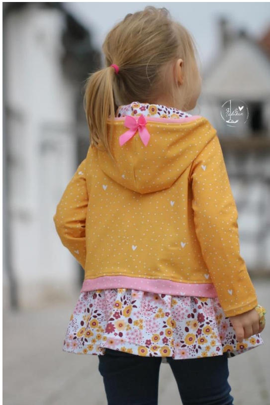
Layer Sweater in Shirlänge mit Kapuze