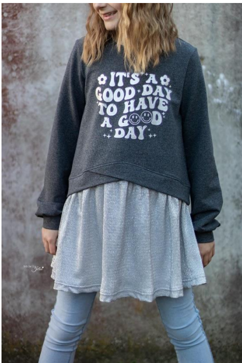
Layer Sweater in Tunikalänge mit Bischofs Ärmeln

Alle Rechte dieses Ebooks (Anleitung und Schnittmuster) liegen bei „Schneiderline“ Für Fehler in der Anleitung oder im Schnittmuster oder für eventuell entstandene Schäden kann keine Haftung übernommen werden. Es ist verboten dieses Ebook, oder Teile daraus, zu veröffentlichen, weiterzugeben, zu vervielfältigen oder zu verkaufen. Ebenfalls ist eine gewerbliche sowie kommerzielle Nutzung untersagt. Es dürfen jedoch bis zu 5, nach diesem Ebook gefertigte Teile verkauft werden. Hierbei bitte angeben: Schnittmuster „Layer Dress“ von Schneiderline