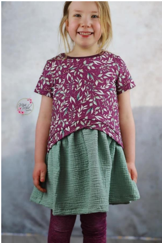
Layer Sweater in Tunikalänge mit kurzen Ärmeln und Rüsche aus Musselin