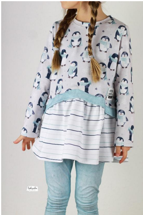
Layer Sweater in Shirlänge mit gesäumten Ärmeln