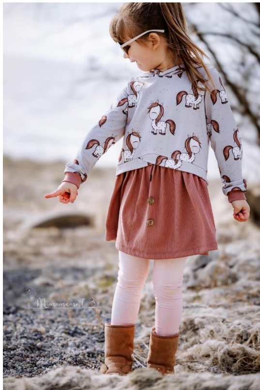
Layer Sweater in Tunikalänge mit Bischofsärmeln und Kapuze

Alle Rechte dieses Ebooks (Anleitung und Schnittmuster) liegen bei „Schneiderline“ Für Fehler in der Anleitung oder im Schnittmuster oder für eventuell entstandene Schäden kann keine Haftung übernommen werden. Es ist verboten dieses Ebook, oder Teile daraus, zu veröffentlichen, weiterzugeben, zu vervielfältigen oder zu verkaufen. Ebenfalls ist eine gewerbliche sowie kommerzielle Nutzung untersagt. Es dürfen jedoch bis zu 5, nach diesem Ebook gefertigte Teile verkauft werden. Hierbei bitte angeben: Schnittmuster „Layer Dress“ von Schneiderline