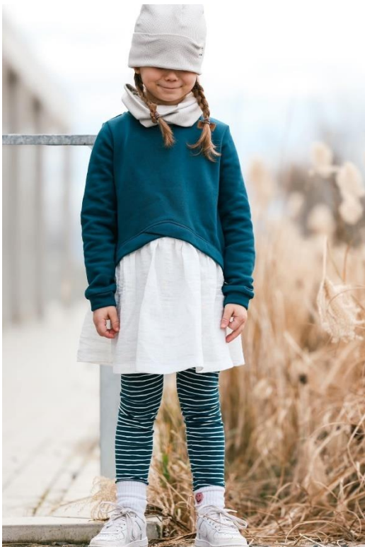
Layer Sweater in Tunikalänge mit Ärmeln mit Bündchen

Alle Rechte dieses Ebooks (Anleitung und Schnittmuster) liegen bei „Schneiderline“ Für Fehler in der Anleitung oder im Schnittmuster oder für eventuell entstandene Schäden kann keine Haftung übernommen werden. Es ist verboten dieses Ebook, oder Teile daraus, zu veröffentlichen, weiterzugeben, zu vervielfältigen oder zu verkaufen. Ebenfalls ist eine gewerbliche sowie kommerzielle Nutzung untersagt. Es dürfen jedoch bis zu 5, nach diesem Ebook gefertigte Teile verkauft werden. Hierbei bitte angeben: Schnittmuster „Layer Dress“ von Schneiderline