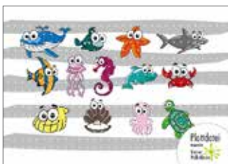
Plotterdateien „Seafriends“ Meerestiere