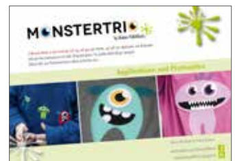
Plotterdateien „Monstertrio“ 3 Monsterfreunde