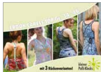
Caress Top/Kleid Sport/Freizeit • Größe 34 - 46