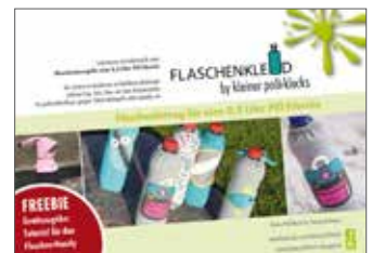
Flaschenkleid für 0,5 PET-Flaschen