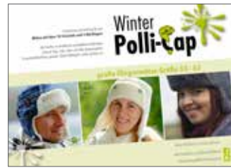
Große Winter Polli-Cap Fliegermütze • Größe 53 - 63