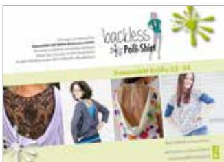
backless Shirt Fledermausshirt • Größe 32-54