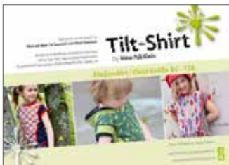
Tilt Kids Shirt/Kleid • Größe 86 - 128