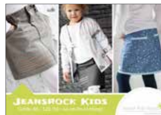
Jeansrock Kids Jeansrock • Größe 86 - 128