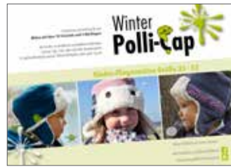
kleine Winter Polli-Cap Fliegermütze • Größe 33-55