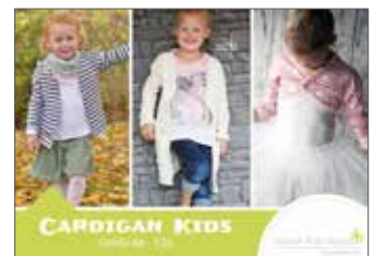
Cardigan Kids Jacke/Mantel • Größe 86 - 128