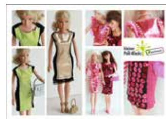
Puppenkleidung für die „schmalen Damen“