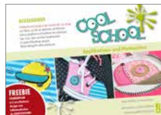
Plotterdateien „Cool School“ Rund um die coole Schule