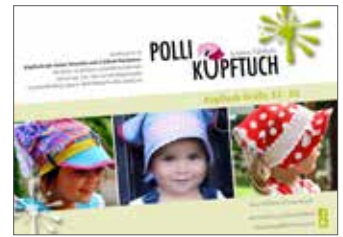
Polli-Kopftuch Kopftuch • Größe 33-55