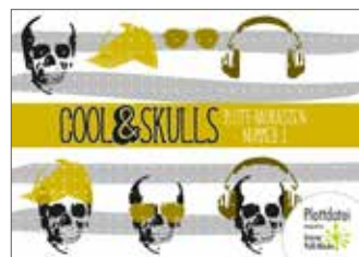
Plotterdateien „cool Skulls“ Cooles und Totenköpfe