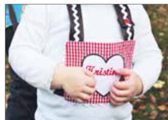
Pferdeleine zum Pferdchen Spielen