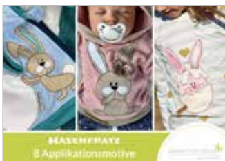
Hasenfratz 8 Applikationsmotive