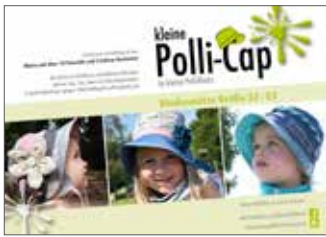
kleine Polli-Cap Sonnenhut • Größe 33-55