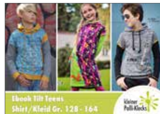
Tilt Teens Shirt/Kleid • Größe 128 - 164