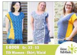
Tilt Damen Shirt/Kleid • Größe 34 - 52