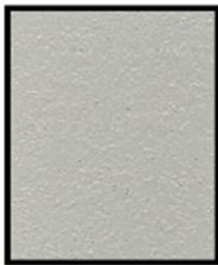
GRIS PÂLE LIGHT GREY MLX-1601

STANDARD COLORS FOR SECURIFORT PRODUCTS.