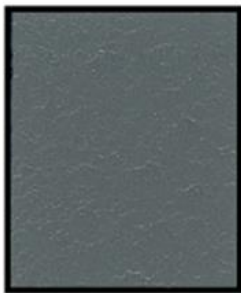
GRIS GREY MLX-20026