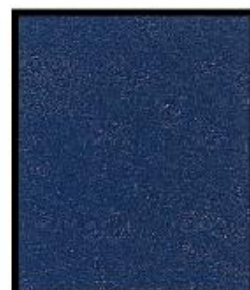
BLEU BLUE MLX-20046