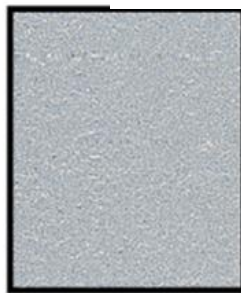
GRIS ALUMIN. ALUMIN. GREY MLX-20050