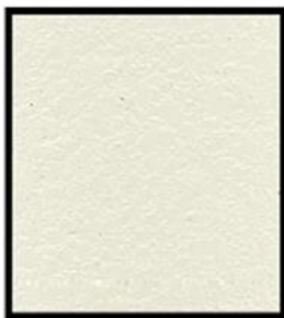
BLANC ANTIQUE ANTIC WHITE MLX-2498