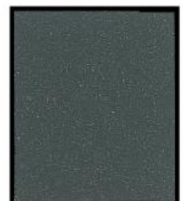
GRIS FONCÉ DARK GREY MLX-3212-53