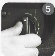
5 Set temperature control to maximum cold. Mettere la temperatura al freddo massimo.