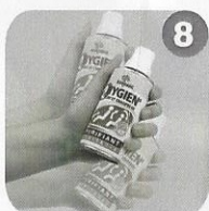
8 Shake can thoroughly. Agitare vigorosamente il flacone.