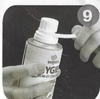
9 Remove the security strip. Togliere la striscia di sicurezza.