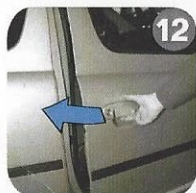
12 Leave the vehicle and let the product act for 15 min. Ventilate well. Uscire dal veicolo e far agire il prodotto per 15 minuti.