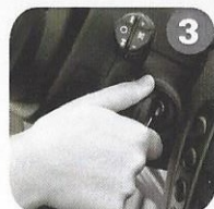
3 Start the engine. Accendere il motore.