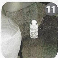
11 Place the aerosol on the floor on the passenger side. Porre il flacone sul pavimento, dalla parte del passeggero.