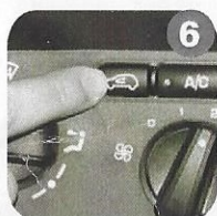
6 Set Air recycling control to ON. Accendere il comando "ricircolo aria" (Mettere su ON).