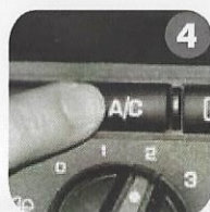
4 Turn Aircon OFF. Spengere l'aria condizionata. (Mettere su OFF).