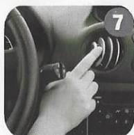
7 Open air vents. Aprire tutti gli sfii di ventilazione.