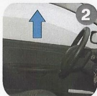
2 Close all windows. Chiudere tutti i finestrini.