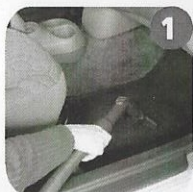
1 Clean the passenger compartment. Pulire l'abitacolo passeggeri.