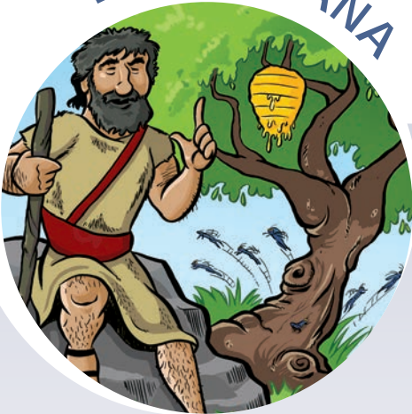
Juan prepara el camino al Señor Mateo 3:1-12