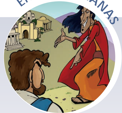
Jesús vence a la tentación Lucas 4:1-13