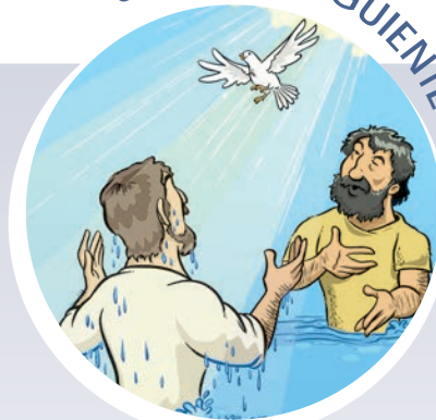
Juan bautiza a Jesús Mateo 3:13-17