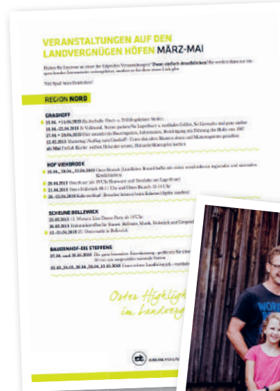
Ihre Veranstaltungen im Landvergnügen-Veranstaltungskalender