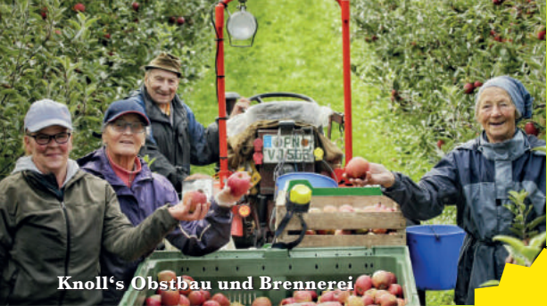
Knoll's Obstbau und Brennerei