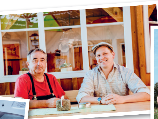
Wertvoller Austausch im Netzwerk zu allen Themen rund um die Ab-Hof-Vermarktung