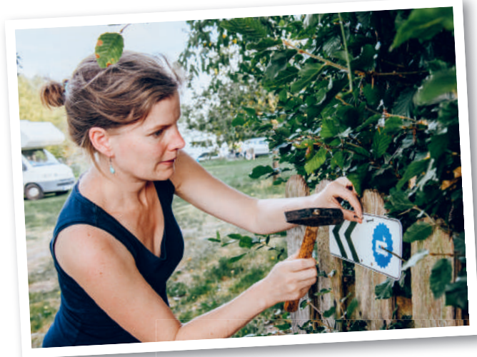
Landvergnügen-Schilder und weitere Gastgeber-Produkte für Ihren Stellplatz