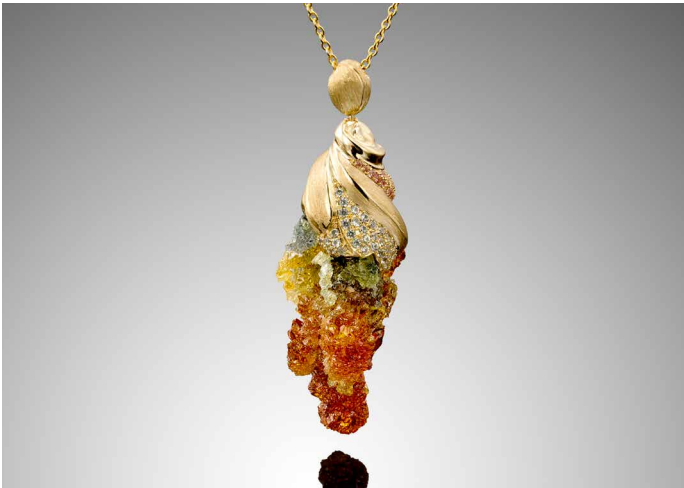
Trip of colours, hänge i 18 k guld och zink med en flerfärgad naturlig safir på 0,61 k.