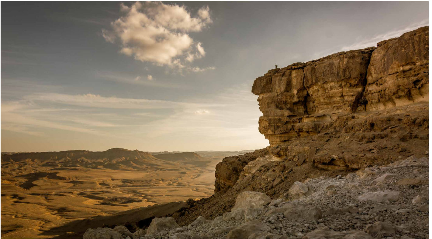
△ Den förtrollande israeliska öknen har alltid varit en stor inspirationskälla för Sharon. ▽ Ringen Spring i 18 k guld med fem keshipärlor.