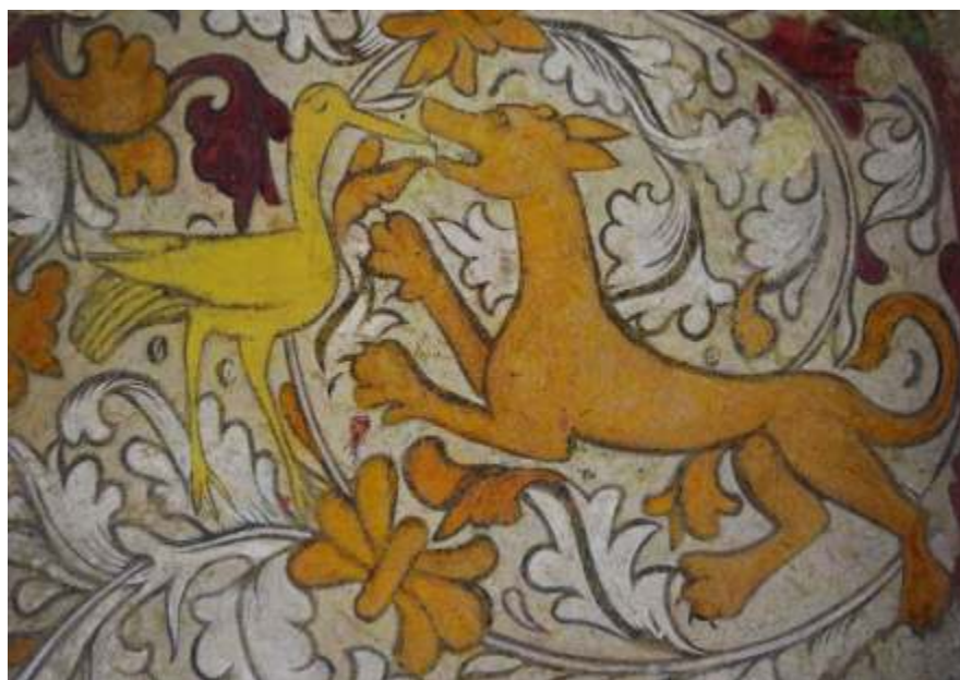
Granatapfel umgeben von Blättern. Der Kranich und der Fuchs.