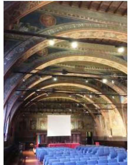
The Sala dei Notari

Wir möchten allen Leitern und Partnern auf dem Gipfeltreffen das Wortes sakrosankt nahelegen im Bezug auf die Bedeutung von Humanität und Kunstgeschichte. Sollte dies auf Unverständnis fallen, dürfte es schwerfallen dem zukünftige Bildungswesen Vertrauen zu schenken.