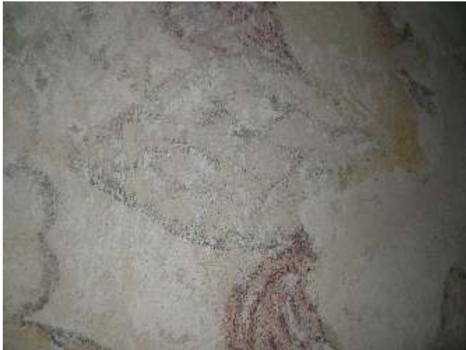
Detaillierter Ausschnitt der Artischocke aus der Wandmalerei im EMH:-