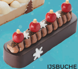
IJSBUCHÉ CHOCOLADE- STRACCIATELLA