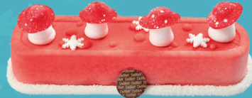
IJSBUCHÉ VANILLE- AARDBEI