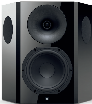
Delningsfrekvenserna på Surroundhögtalaren är 1,4 kHz mellan åtta och diskant, medan fyrtummarna har ett högpassfilter vid 200 Hz.

Mellanmodellen bland 1723-seriens basar har två element, 1 kW slutsteg och är sluten.