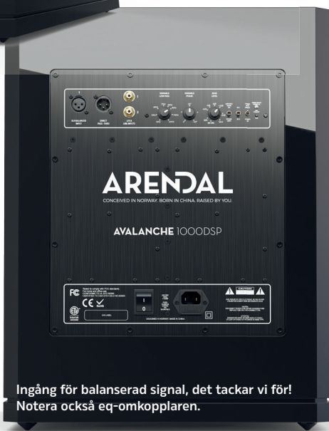
Ingång för balanserad signal, det tackar vi för! Notera också eq-omkopplaren.