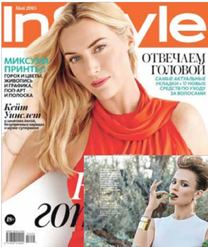
InStyle May Issue 2015