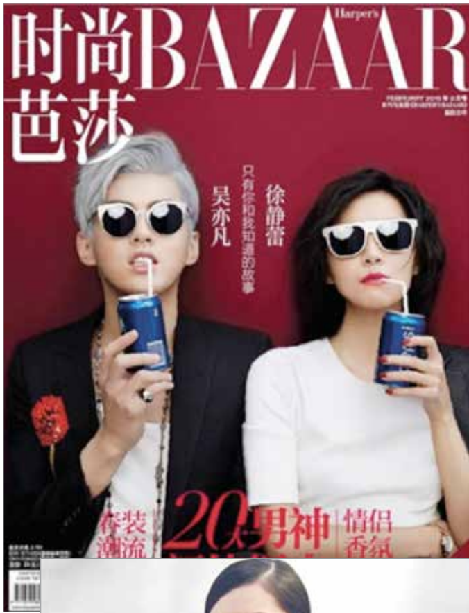
Harper's Bazaar Jewellery February 2015