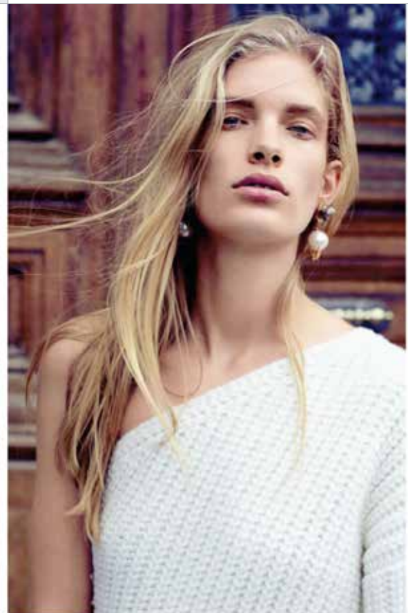
Шпиртное внале, 43 000 руб., Stella McCartney: сумка из шерсти с лозанной и искусственные жемчуг, 28 700 руб., Crystalline.