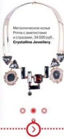
Металлическое кольцо Рита с аметистами и стразами, 34 000 руб., Crystalline Jewellery.

Новый бренд Crystalline Jewellery запустили две бывшие сотрудницы русских Tatler и Vogue. Острое модное чутье подсказало им идеи для дебютной коллекции геометричных украшений из опалки, аметистов и кварца.