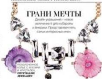
Металлическое кольцо с аметистом и стразами, 34 000 руб., Crystalline Jewellery.

Дважды украшений – новые коллекции в духе Барокко и Ампир. Приходите выбирать самые интересные идеи.