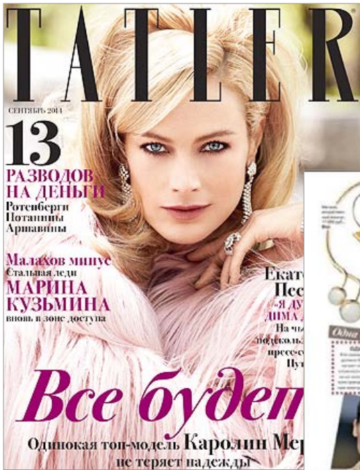
TATLER Russia September 2014