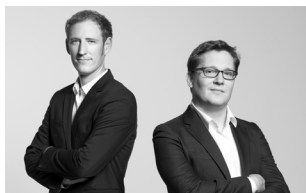
Design by Bernard / Burkhard

Thanks to all people involved in this project: Del Xu for the organisation in Asia, John Ye for the development, engineering and CAD work, Mario Rothenbühler for the photos, Fabian Bernhard and Thomas Burkard for the beautiful slim design, Matti Walker for the graphic work.