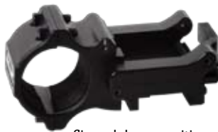
flipped down position