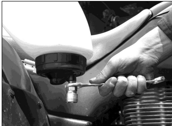
Montering af messing quick kobling

Hvis ventilerne på din Sprayrider™ G2 ikke har en prop skruet ind i bundhætten kontakt venligst C-Dax LTD – gratis telefon 0800 230 230.