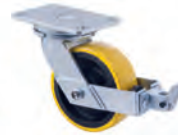
XZPBR Plate with swivel and wheel brake