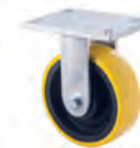
XZF Fixed plate, no swivel