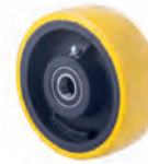
XUQ PU on cast iron, precision bearing