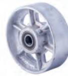
XCQ Cast iron, precision bearing