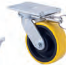
XZPDL Plate with swivel and direction lock