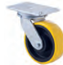
XZP Plate with swivel