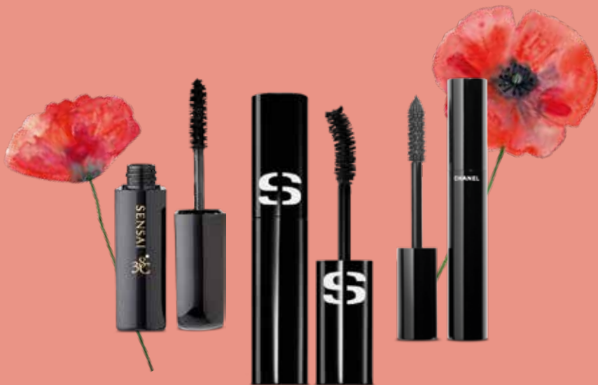
Corinne Araujo, Lash Volumiser Black 38°C, Sensai

Tauchen Sie ein in die Welt verführerischer Wimpern mit den Mascara-Empfehlungen unseres Teams. Von intensiver Länge bis hin zu perfekter Krümmung bieten diese Produkte alles, was Sie für einen atemberaubenden Augenaufschlag benötigen.