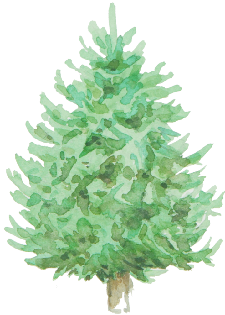
Ganz genau, ein Tannenbaum!