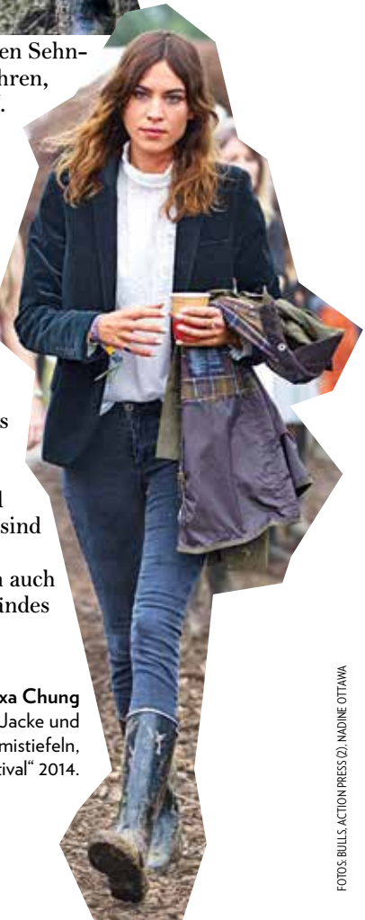
Alexa Chung mit Barbour-Jacke und Hunter-Gummistiefeln, „Glastonbury Festival“ 2014.

Auf Festivals werden Trends gesetzt: So sah man die großartige Sängerin Florence Welch letztes Jahr schon beim „Glastonbury“ in bestickter Lederweste und passender Fransenjacke. Und siehe da, 2015 tragen es alle It-Girls dieser Welt. Nachdem Kate Moss beim „Glastonbury“ 2005 die Tage und Nächte in „Wellies“ durchtanzte, machte das britische Traditionsunternehmen Hunter weltweit ein Umsatzplus von 66 Prozent – und die grünen Gummistiefel sind seitdem ein Must-have. Paris Hilton hingegen sah man als Hasen-Braut, ganz in Weiß, viel Chloé und mit mutigem Ohrenschmuck. Das beweist, dass ein Musikfestival der ideale und absolut geschützte Raum für modische Träume und Herzensangelegenheiten ist. Man darf und sollte sogar immer ein bisschen übers Ziel hinausschießen. Das wichtigste aller Accessoires ist und bleibt ein guter Vibe. Wie sonst soll man Love und Peace authentisch zelebrieren? Sogar Gänseblümchenkettchen in den Haaren sind erlaubt! Also, schauen Sie doch mal, wie es um Ihren inneren Hippie so steht – modische Gründe, in diesem Sommer ein Festival zu besuchen, gibt es mehr als genug. Wir verraten auch niemandem, dass Sie sich stillschweigend ein Vier-Sterne-Hotel ganz in der Nähe des Geländes gebucht haben. Das Dosenbier brauchen Sie allerdings nicht zu verstecken.