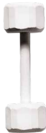
Nike, um 15 Euro

Der Countdown zur Bikini-Saison ist fast runtergezählt! Wer jetzt noch an seiner Figur zweifelt: Neue Trendsportarten machen jede Menge Spaß und bringen den Body in Sommerform. Kleiner Ansporn: die schönsten Sportaccessoires in Pastellfarben!