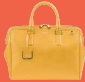
Tasche Um 950 Euro, über Serapian.com

Trendy in Pastelltönen: die Sängerin im himmelblauen 60s-Minikleid. Dazu peachfarbene Lackpumps und die sonnen-gelbe „Ani“-Bag des ange-sagten Labels Serapian.