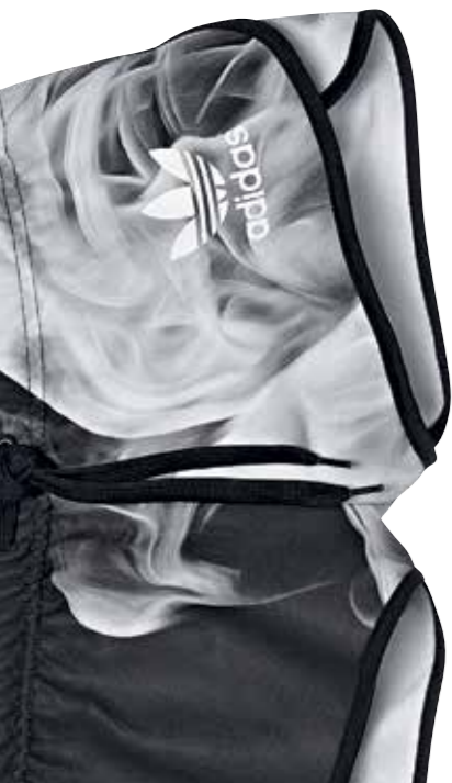
Adidas by Rita Ora, um 55 Euro