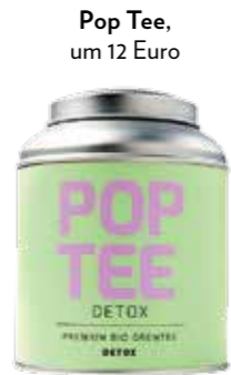
Pop Tee, um 12 Euro

Wer als Teenager seine Ballettschuhe eingemottet hat, kann sie jetzt wieder rausholen, denn bei Celebritys wie Doutzen Kroes feiert das Tanztraining gerade ein großes Revival. Dass Ballett gute Haltung und einen graziösen Körper trainiert, ist bekannt. Neu ist allerdings „Hot Barre“ – ein Mix aus Ballett- und Pilatesübungen, die bei 35 Grad Raumtemperatur an der Querstange ausgeführt werden. Die Hitze macht Muskeln beweglicher und hilft gleichzeitig beim Detoxen!