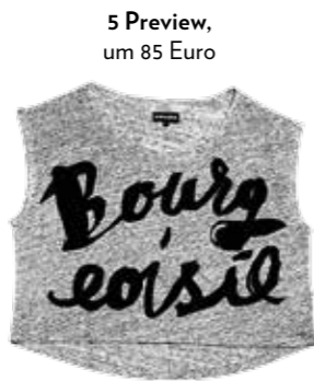
5 Preview, um 85 Euro