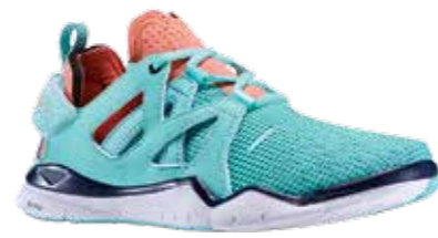
Reebok, um 100 Euro