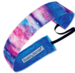
Sweaty Bands, um 10 Euro