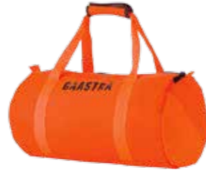
Gastra, um 70 Euro