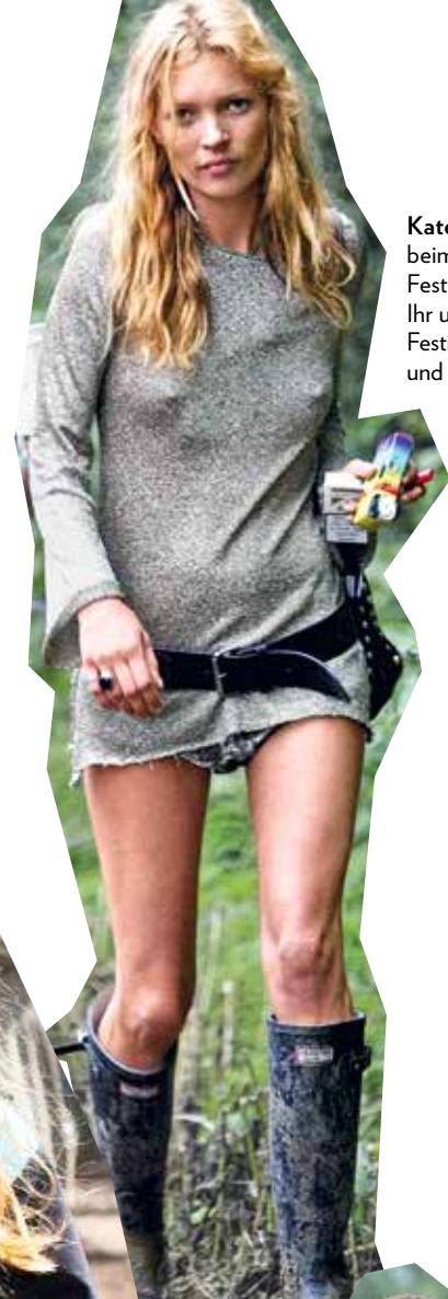
Kate Moss beim „Glastonbury Festival“ 2005. Ihr ultimativer Festival-Look: sexy und praktisch.