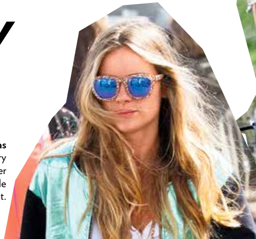
Cressida Bonas 2014 beim „Glastonbury Festival“. Ob Sonne oder Regen, sie ist auf jede Wetterlage vorbereitet.

Spätestens seit Woodstock 1969 sind Festivals der Inbegriff von Jugend, Freiheit und wilden Sehnsüchten. Die offiziellen Überfestivals, um die heißesten Sommertrends am Körper auszuführen, sind das „Coachella“ in der kalifornischen Wüste und das englische „Glastonbury Festival“. Mindestens für ein langes Wochenende verwandelt sich ein sonst recht unberührtes Stück Natur in einen Outdoor-Laufsteg. Neben den coolsten Streetstyles führen die Stars ihre Designerroben in einem betont lässigen Umfeld aus. Beim „Coachella“ stieg Beyoncé in einem absoluten Saint-Laurent-Dream-Dress aus dem Helikopter, Newcomer-Model Gigi Hadid kam im Cowboy-und-Indianer-Look mit gefühlten zwei Tonnen Silberschmuck.