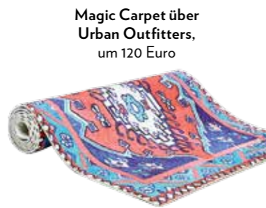
Magic Carpet über Urban Outfitters, um 120 Euro