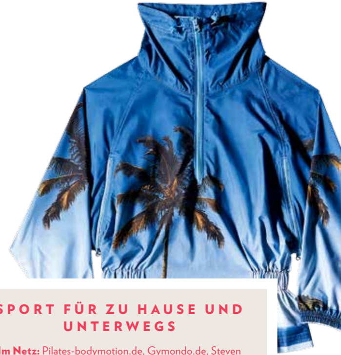
Adidas by Stella McCartney, um 230 Euro