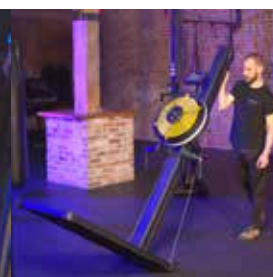
Roues intégrées pour un transport facile

FITNESSTRADING PREMIUM QUALITY - EXCELLENT SERVICE