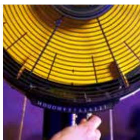
Système de résistance magnétique réglable manuellement