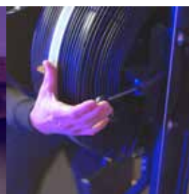
Levier pour placer l'unité principale dans la position souhaitée