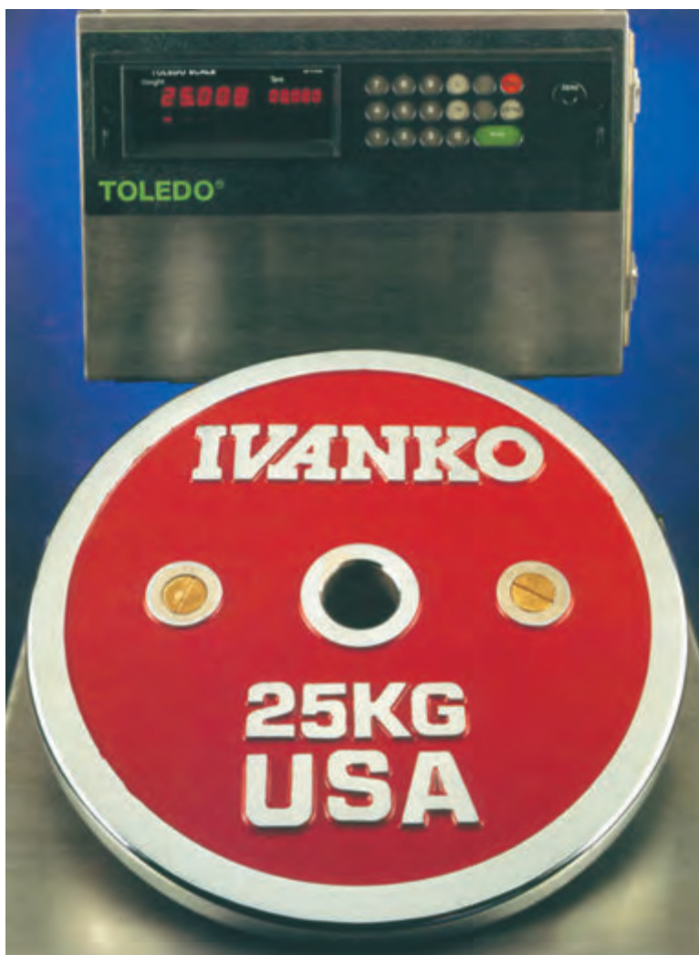
Le bilance personalizzate Toledo della Ivanko hanno una precisione di 2 g.

centuale di rifusione”) e in realtà fa risparmiare soldi. Quindi, in realtà si ha una qualità superiore con costi confrontabili a quelli di produttori