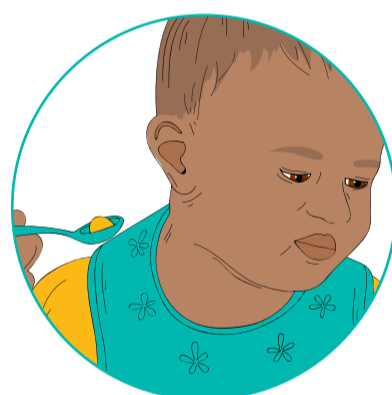
Ka huri kanohi atu