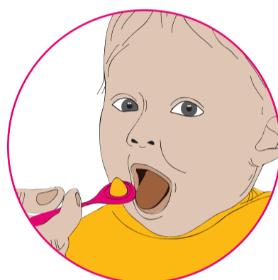
Kia tata, kia pā rānei te pune ki tōna ngutu, hāmama tonu mai te waha