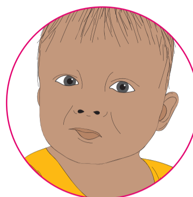
E komikomi ana te waha ānō nei e kai ana ia