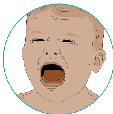
Ka tangi pākatokato