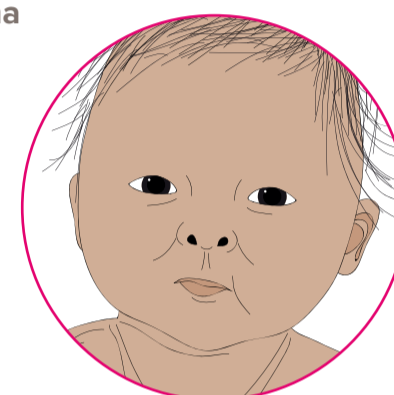
Ka tau te kai ki roto i te waha, ā, ka horomi, tē tuhaina e ia