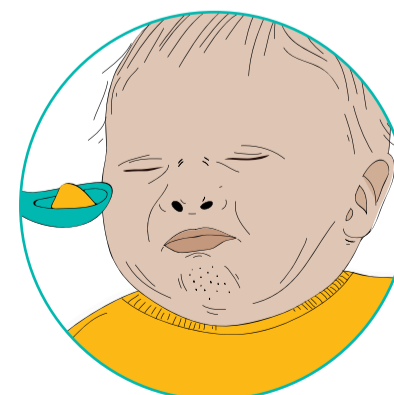
Ka kopia te waha

He tino mōhio ngā pēpi mēna kei te hiakai tonu, kua whiu rānei. Ko ētahi pēpi he kaha atu i ētahi atu ki te kai.