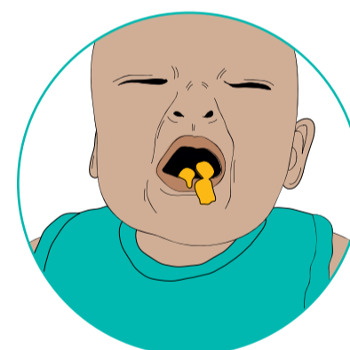
Ka tuhaina te kai