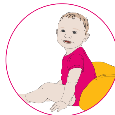
E kaha ana ia ki te hiki i tōna māhunga me te noho