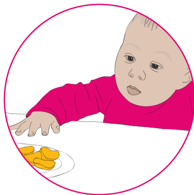
He pai ki a ia te kai