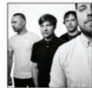
Les Trois Accords