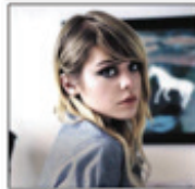
Cœur de pirate