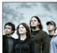
Les Cowboys Fringants