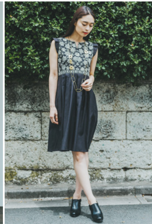
手織りコットンシルク・ハイウエストドレス ¥36,000 (税込 ¥38,880)

ブラック地に大小異なるカラフルなクロスステッチをちりばめたドレス。Aラインのシルエットに、フリルの袖が女性らしい印象。