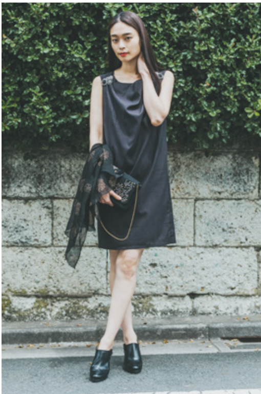
手織りコットンシルクドレス ¥23,000 (税込 ¥24,840)

ピープツツリーが提案する、「ブラックドレス」シリーズ 特別な日には特別なドレスを。 手織り生地に繊細な手刺繍をあしらったコレクションです。 パーティーに花を添えるのは間違いなし！