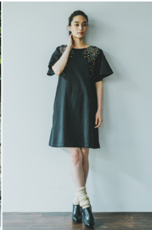
カラフル手刺繍ドレス ¥14,000 (税込 ¥15,120)

胸元のドレープがフォーマル感をアップしてくれるリトルブラック。肩前面にビーズの飾りは取り外せてシンプルなドレスとしても着られます。