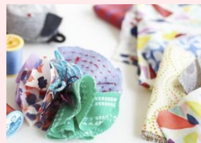
フラワーコサージュを手作り