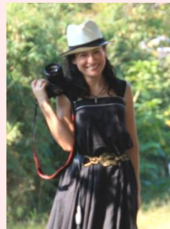
サフィア・ミニーが撮影します

メールでSkohoku@peopletree.co.jp までお名前とご連絡先をお送りいただくか、お電話にて045-914-2254 (ピープル・ツリー モザイクモール港北店)まで。