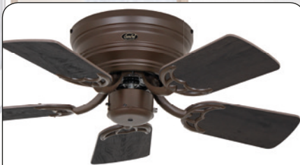
FLAT 75-III BZ #5075371 Gehäuse Bronze, 5 Wendeflügel Altholz Eiche/Eiche kolonial (sichtbar)