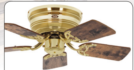
FLAT 75-III MP #5075001 Gehäuse Messing poliert, 5 Wendeflügel Altholz Eiche (sichtbar)/Ahorn