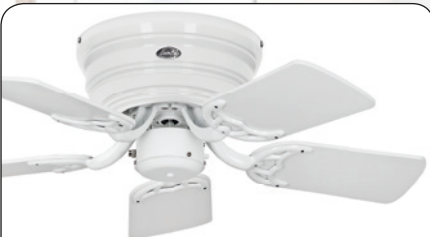
FLAT 75-III WE #5075061 Gehäuse Lack weiß, 5 Wendeflügel Lack weiß (sichtbar)/Lichtgrau