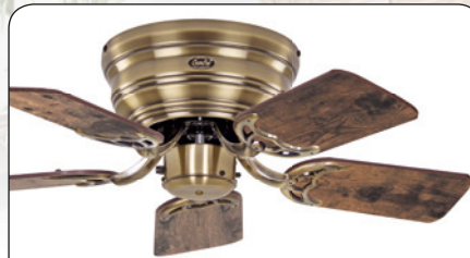
FLAT 75-III MA #5075041 Gehäuse Messing antik, 5 Wendeflügel Altholz Eiche (sichtbar)/Ahorn