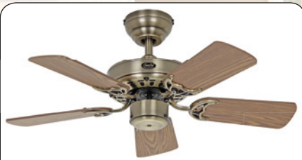
ROYAL 75 MA #507501 Gehäuse Messing antik, Wendeflügel Eiche antik (sichtbar) Wildeiche