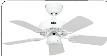
ROYAL 75 WE #507503 Gehäuse Lack weiß, Wendeflügel Lack weiß (sichtbar)/Lack lichtgrau