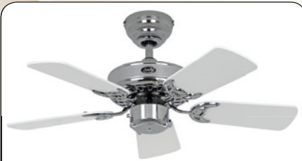
ROYAL 75 CH #507502 Gehäuse Chrom glänzend, Wendeflügel Lack weiß (sichtbar)/Lack lichtgrau