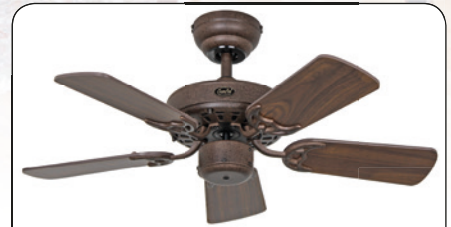
ROYAL 75 BA #507513 Gehäuse Lack braun antik, Wendeflügel Nussbaum (sichtbar)/Nussbaum dunkel