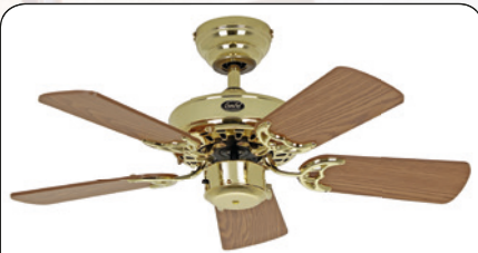
ROYAL 75 MP #507509 Gehäuse Messing poliert, Wendeflügel Eiche antik (sichtbar) Wildeiche