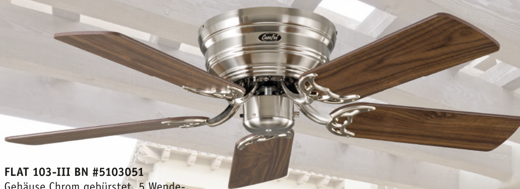
FLAT 103-III BN #5103051 Gehäuse Chrom gebürstet, 5 Wende- flügel Nussbaum (sichtbar)/Buche