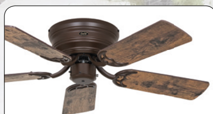
FLAT 103-III BZ #5103371 Gehäuse Bronze, 5 Wende- flügel Altholz Eiche (sichtbar)/Eiche kolonial