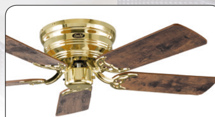
FLAT 103-III MP #5103001 Gehäuse Messing poliert, 5 Wendeblätter Altholz Eiche (sichtbar)/Ahorn