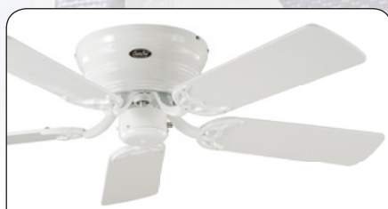
FLAT 103-III WE #5103061 Gehäuse Lack weiß, 5 Wendeblätter Lack weiß (sichtbar)/Lichtgrau