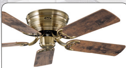
FLAT 103-III MA #5103041 Gehäuse Messing antik, 5 Wendeblätter Altholz Eiche (sichtbar)/Ahorn