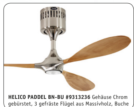
HELICO PADDEL BN-BU #9313236 Gehäuse Chrom gebürstet, 3 gefräste Flügel aus Massivholz, Buche