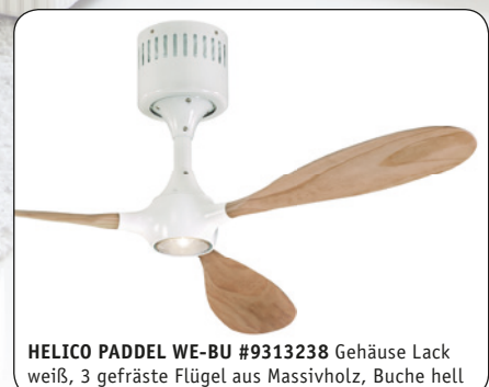
HELICO PADDEL WE-BU #9313238 Gehäuse Lack weiß, 3 gefräste Flügel aus Massivholz, Buche hell