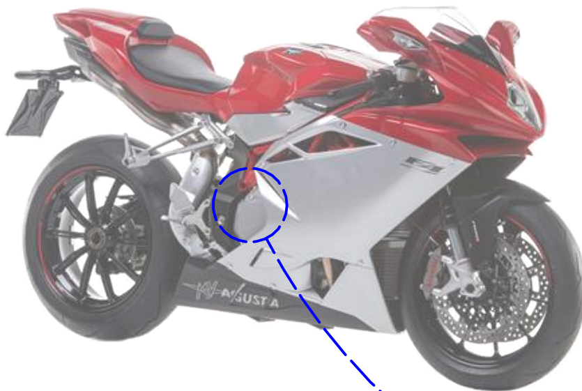
Immagine usata a fini esclusivamente illustrativi Image used for illustrative purposes only

PRIMA DI SERRARE LE VITI ASSICURARSI CHE IL PIATTELLINO SIA IN ADERENZA AL PACCO DISCHI FRIZIONE