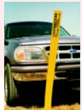
Resistente al impacto