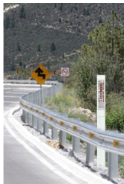
Señalamiento en carreteras