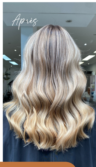
Balayage Infinite Polaire