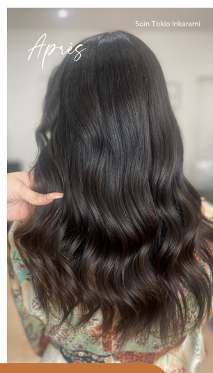
Soin Tokio Inkarami