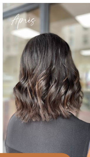
Coupe & Brushing