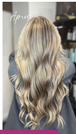
Balayage Hair Design