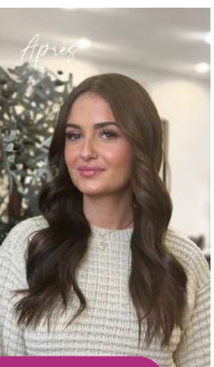
Soin Tokio Inkarami