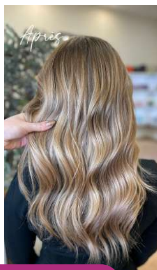
Balayage Hair Design