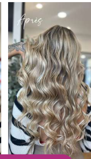
Balayage Hair Design