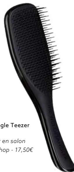
Brosse Tangle Teezer

Matin et soir, on vient démêler délicatement ses cheveux en commençant par les pointes puis on brosse à mi-longueur en faisant attention aux racines pour ne pas abîmer les bandes des extensions. Utilisez une brosse adaptée ou un peigne aux dents larges et assez espacées. Vous pouvez traiter vos extensions de la même façon que vos cheveux, les coiffer, les brusher, les lisser mais évitez de les sécher la tête vers le bas.