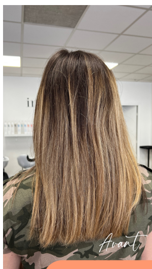
Balayage Hair Design