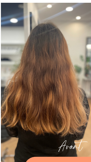
Balayage Hair Design