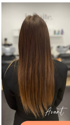
Balayage Hair Design