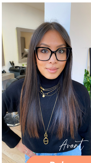
Balayage Hair Design