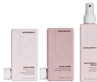
Routine cheveux fins

Soignez et revitalisez vos cheveux fins, plats ou clairsemés en leur redonnant corps et volume avec la Routine spéciale cheveux fins.