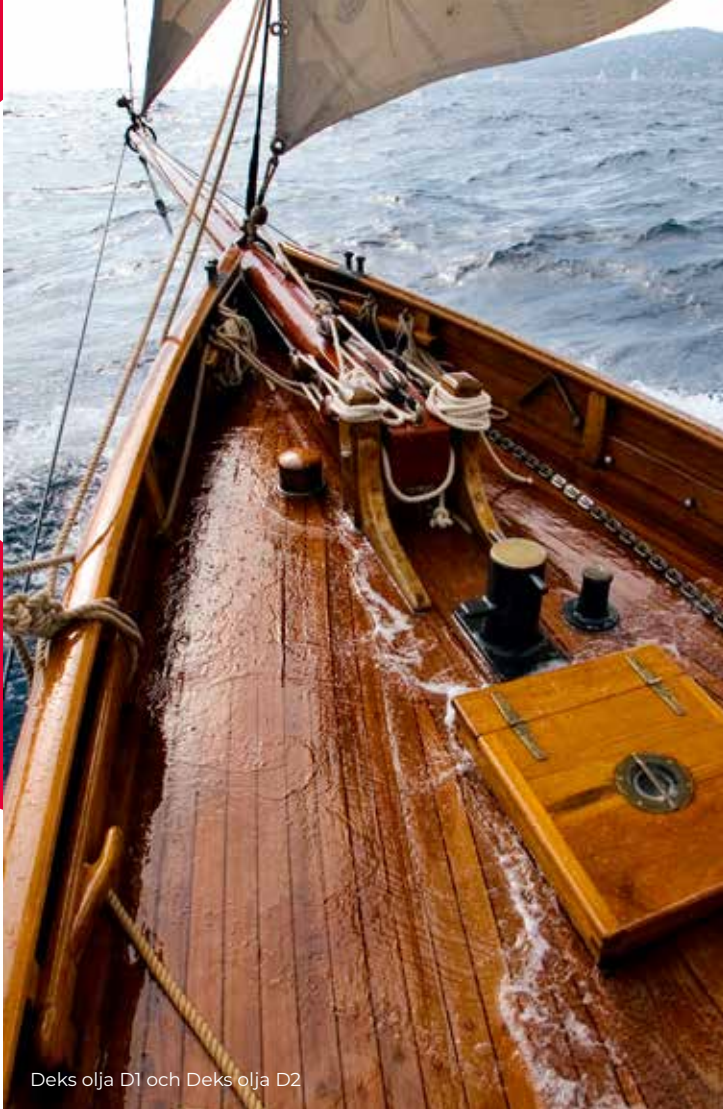
Deks olja D1 och Deks olja D2