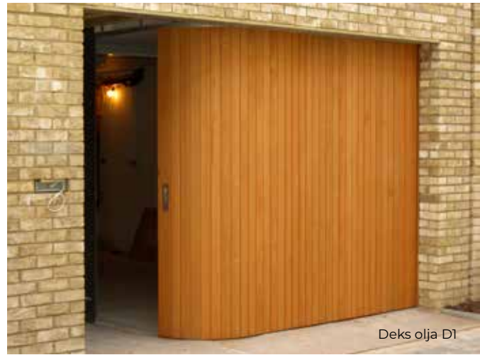
Deks olja D1