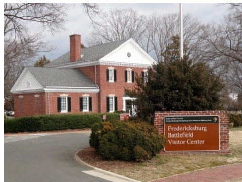
Fredericksburg and Spotsylvania Military Park

9-10am visit Fredericksburg and Spotsylvania Military Park 1013 Lafayette Blvd, Fredericksburg, VA 22401