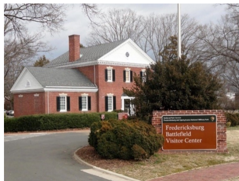
Fredericksburg and Spotsylvania Military Park

1:30pm salida hacia el parque Kings' Dominion 16000 Theme Park Way, Doswell, VA 23047