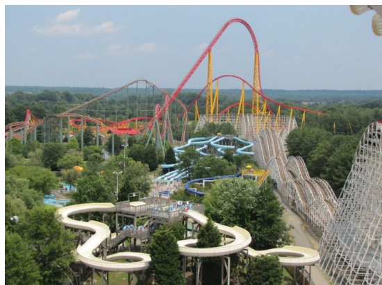
Kings' Dominion Amusement Park