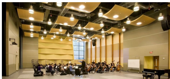
George Mason University School of Music