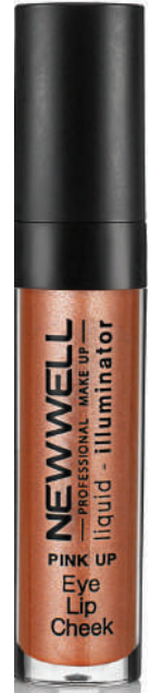
Pink - Up 8680923345987