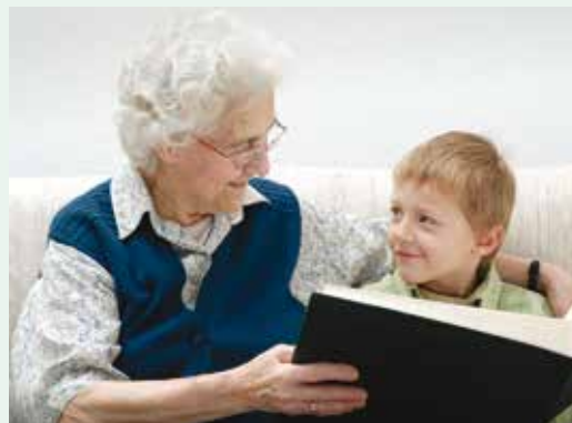
Poseban odnos ovog djeteta s bakom potiče otpornost. Pružajući socijalnu podršku, ona mu pomaže nositi se sa stresom i konstruktivno rješavati probleme.

No, kada se nagomilaju mnogi rizici, sve teže ih je prebroditi (Luthar, 2006). Kako bi se djecu "cijepilo" protiv negativnih utjecaja rizika, intervencije ne samo da moraju smanjiti te rizike nego i poboljšati zaštitne odnose djece kod kuće, u školi i u zajednici. To znači obratiti pažnju i na osobu i na okolinu, odnosno ojačati kapacitete djeteta i istovremeno smanjiti rizična iskustva.