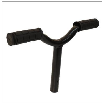
1x Spiel-Lenkstange (ohne Lenkfunktion)