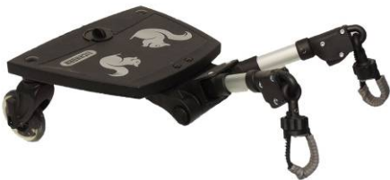
- nur als Board EAN 4251056320536

Der Cozy T-Rider ist in zwei Ausführungen erhältlich: