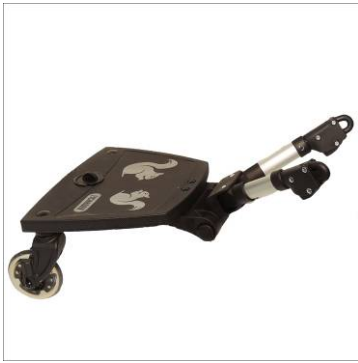
1x T-Rider-Board mit 2 Rädern und Teleskophalterung