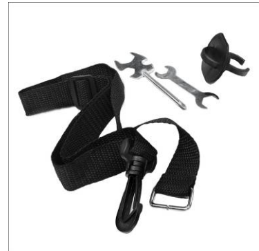
1x Werkzeugset mit Abdeckkappe und Halteband zum Hochbinden