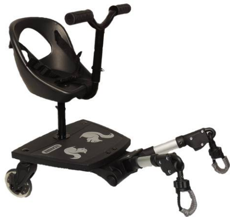
- mit zusätzlichem Sitz EAN 4251056320505