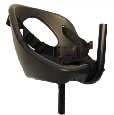
1x Sitz mit Gurtsystem