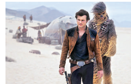
A still from Solo: A Star Wars Story

China, on track to overtake the US in movie ticket sales by 2020, is an important market for Hollywood films, including some franchises like Universal Pictures' Fast and Furious , which has sometimes generated more revenue in the country than in North America. That's one reason Disney keeps pushing the Star Wars series in the country, where Solo secured a rare