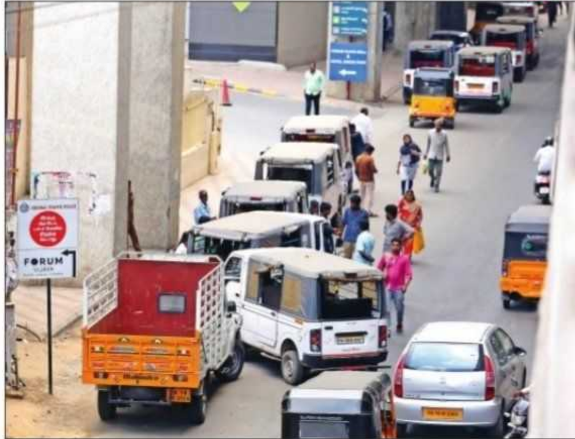
வடபழனி சின்னல் அருகே 100 அடி சாலையில் போக்குவரத்துக்கு இடையூறு ஏற்படும் என்பதால் சாலையோரத்தில் வாகனங்கள் நிறுத்தக்கூடாது என போக்குவரத்து போலீசார் அறிவிப்பு பலகை வைத்துள்ளனர். இதை மீறி அந்த பகுதியில் வாகனங்களை நிறுத்தியுள்ளனர்.

புதுச்சேரி, மே 29- புதுவை கவர்னராக கிரண் போடி பதவியேற்று 2 ஆண்டுகள் நிறைவடைந்ததையொட்டி கவர்னர் மாளிகையில் நேற்று முதல்வர், அமைச்சர்கள், எம்எல்ஏக்களுக்கு விருந்தளிக்க ராஜ் நிவாஸ் அழைப்பு விடுத்திருந்தது. ஆனால் இந்த நிகழ்ச்சியில் முதல்வர் நாராயணசாமி, மற்றும் அமைச்சர்கள், எம்எல்ஏக்களும் கலந்து கொள்ளவில்லை. அதேநேரத்தில் எதிர்க்கட்சியான என்ஆர் காங்கிரஸ் எம்எல்ஏக்கள் எதிர்க்கட்சி தலைவர் ரங்கசாமி தலைமையில் கலந்து கொண்டனர். இது தவிர பாஜகவைச் சேர்ந்த