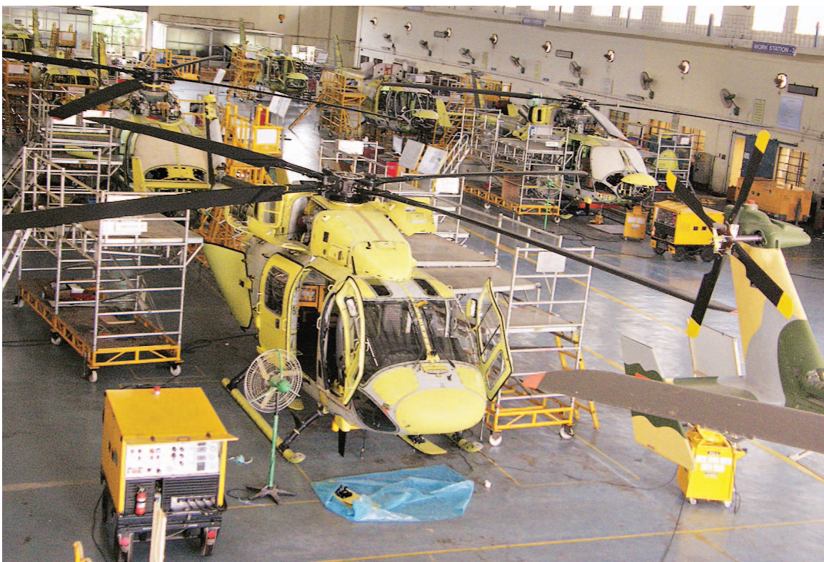
Tamil Nadu has set a target to attract ₹100 billion in aerospace and defence

Tamil Nadu is relying on its entrepreneurial ecosystem to race past Uttar Pradesh and build the country's first defence corridor