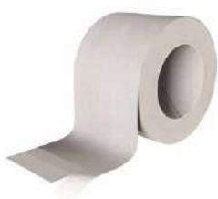
MANICA PLASTER page 138