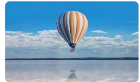
ヨーロッパ33カ国 (1,177円～)