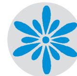
Blau Stand By