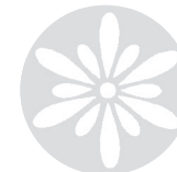
Weiss Voll geladen