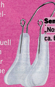
Seminismar „Nose Shaper“, ca. 6 Euro

Formt von Außen! Der weiche Silikon-Clip wird dafür einfach auf die Nase gesetzt. Den Edelstahlraht kann man mit den Fingern einfach verschieben, sodass der Druck sich individuell einstellen lässt. Um die ersten Ergebnisse zu sehen, muss der Shaper jeden Tag für eine halbe Stunde getragen werden.