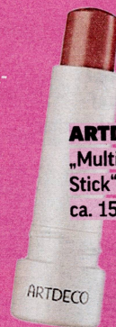
ARTDECO „Multi-Contour-Stick“, ca. 15 Euro

Wo Schatten ist, ist auch Licht! Vor allem, wenn es um eine gerade Nase durch Contouring geht. Einfach zwei dunkle Linien auf den Seiten der Nase ziehen, mit einem Lidschatten-Pinsel leicht verblenden! Durch den hellen Kontrast auf dem Nasenrücken wirkt die Nase schmaler.