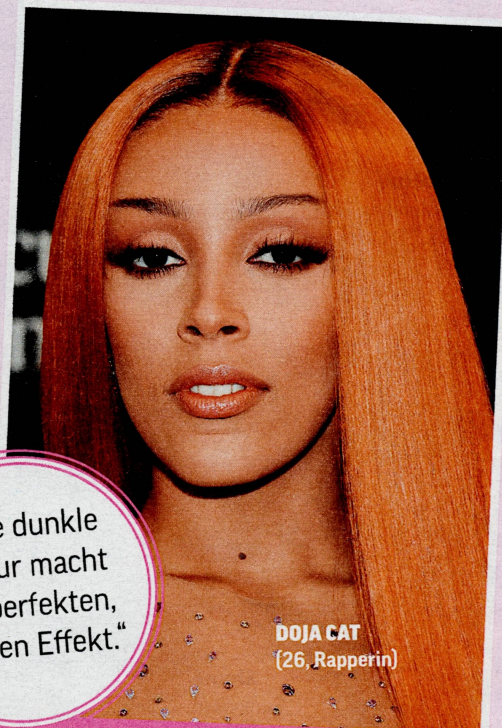
DOJA CAT (26, Rapperin)

Hyaluron ist flexibel Durch das richtige Verhältnis der ästhetischen Einheiten kann die Nase auch stupziger aussehen