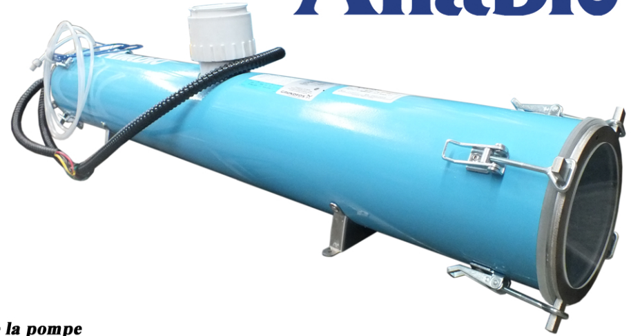
Vue du côté # 1