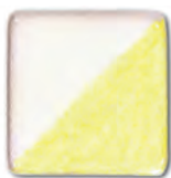
Lemon Yellow 02