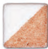
Dark Red 01