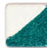
Emerald Green 11