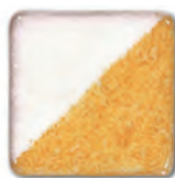
Gold Yellow 09