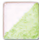
Light Green 14