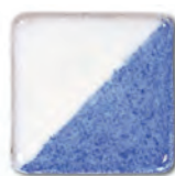
Ocean Blue 17