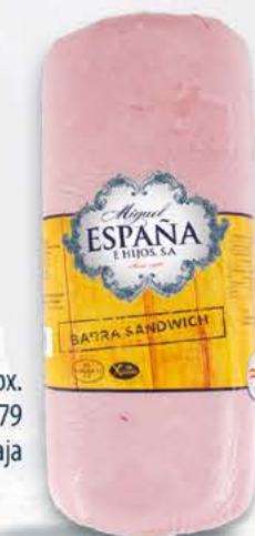
03055 - Barra Sandwich 3 kg aprox. 8436034750079 2 x caja