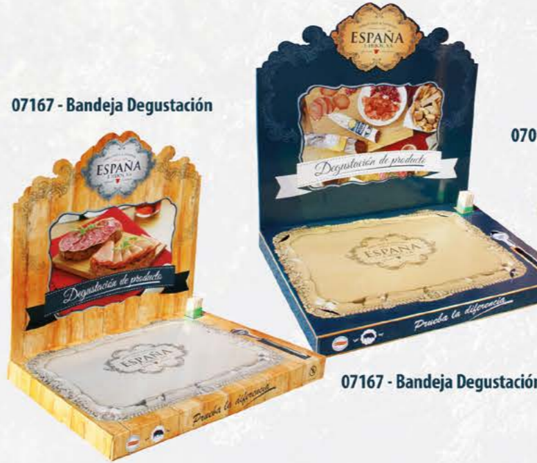
07167 - Bandeja Degustación