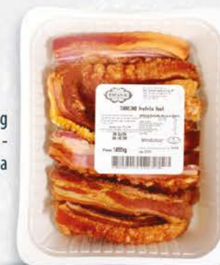
03062 - Torrezno Prefrito 400 g 8 x caja