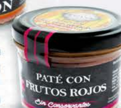
03819ESP - Paté con Frutos Rojos 100 g 8436567891591 48 x caja