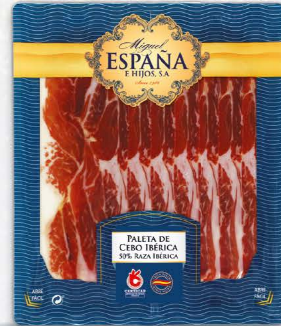
01506 - Paleta de Cebo Ibérica 50% Raza Ibérica 80 g 8428204015064 12 x caja