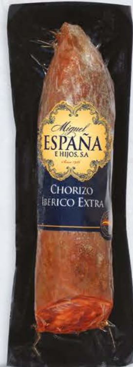
01191 - Chorizo Cular Ibérico Extra 400 g 8428204012230 16 x caja