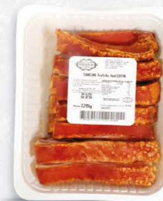
03060 - Torrezno Prefrito Extra 1,5 kg aprox. 8 x caja