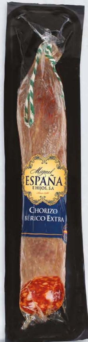
01010V - Chorizo Cular Ibérico Extra 1,1 kg aprox. 8428204000220 6 x caja