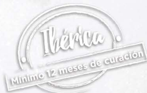
02125 - Paleta de Cebo de Campo Ibérica 50% Raza Ibérica 4,3 kg aprox. 8428204011752 2 x caja