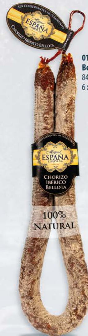
01014 - Chorizo Sarta Ibérico Bellota 300 o 500 g 8428204016900 6 x caja