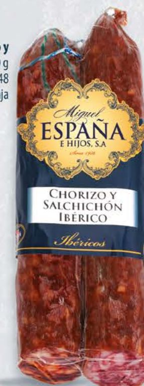
01116PMIXA - Chorizo Ibérico y Salchichón Ibérico 500 g 8428204003948 12 x caja