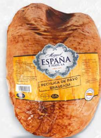
03053 - Pechuga de Pavo Braseada 4,5 kg aprox. 8436034750161 1 x caja