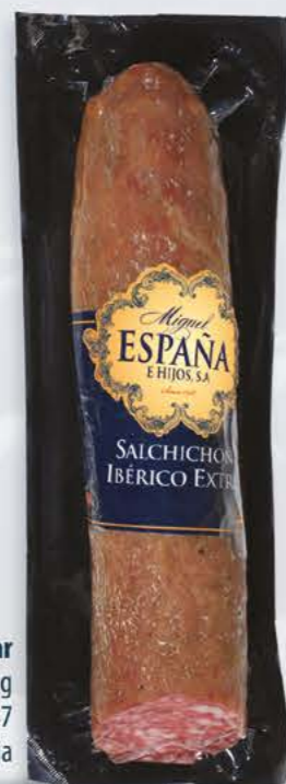
01192 - Salchichón Cular Ibérico Extra 400 g 8428204012247 16 x caja