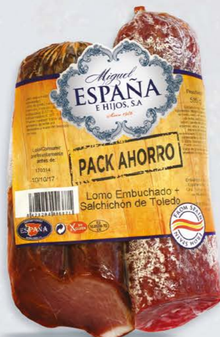
01249 - Lomo Gran Reserva y Salchichón de Toledo 585 g 8428204006871 6 x caja