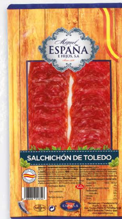
01556 - Salchichón de Toledo 45 g 8428204006321 25 x caja