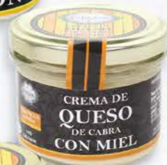
03835ESP - Crema de Queso de Cabra con Miel 100 g 8436567892666 48 x caja