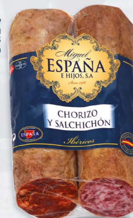
01010MIXAP - Chorizo y Salchichón Ibérico 900 g 8428204004235 6 x caja