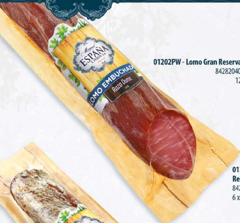
01202PW - Lomo Gran Reserva 300 g 8428204018492 12 x caja