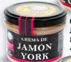
03817ESP - Crema de Jamón York 100 g 8436567891560 48 x caja