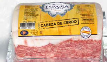
03022 - Cabeza de Cerdo 3,2 kg aprox. 84268204002132 2 x caja