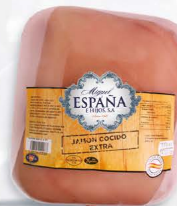
03059 - Jamón Cocido Extra Magnus 2,8 kg aprox. 8428204002088 1 x caja