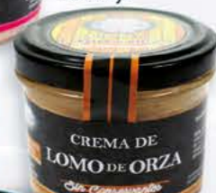
03818ESP - Crema de Lomo de Orza 100 g 8436567891607 48 x caja