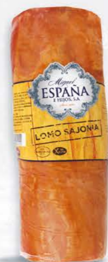
03048 - Lomo de Sajonia Mitades 3,5 kg aprox. 8437002658151 2 x caja