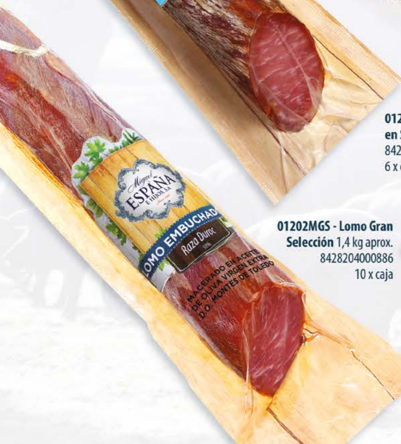
01202MGS - Lomo Gran Selección 1,4 kg aprox. 8428204000886 10 x caja