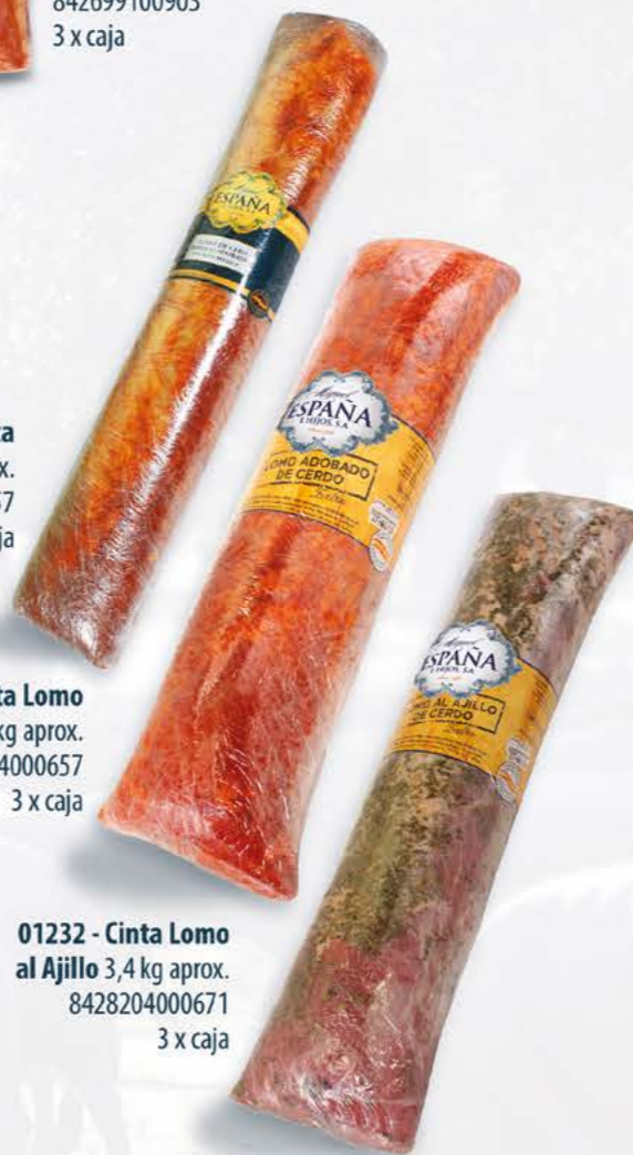
01234 - Cinta Lomo Adobada Ibérica 50% Raza Ibérica 3,4 kg aprox. 8428204013657 2 x caja