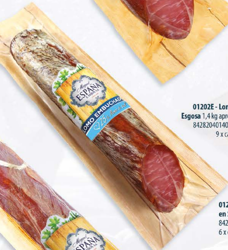
01202E - Lomo Esgosa 1,4 kg aprox. 8428204014050 9 x caja