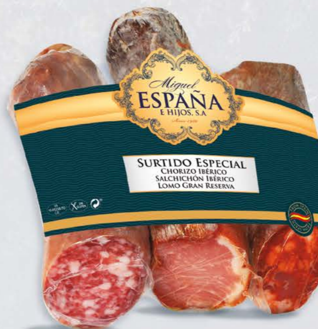
01636 - Surtido Especial 900 g 8428204007014 5 x caja