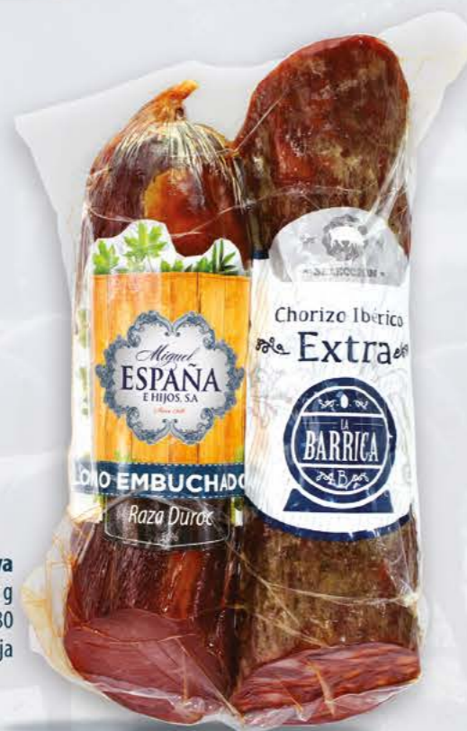
01202MIXAP - Lomo Gran Reserva y Chorizo Ibérico Extra 950 g 8428204004280 6 x caja