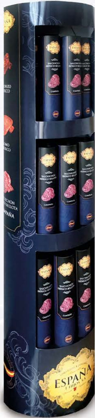
07171 - Expositor Especial Tubos (An.: 38 cm / Al.: 158 cm / Prof.: 38 cm)