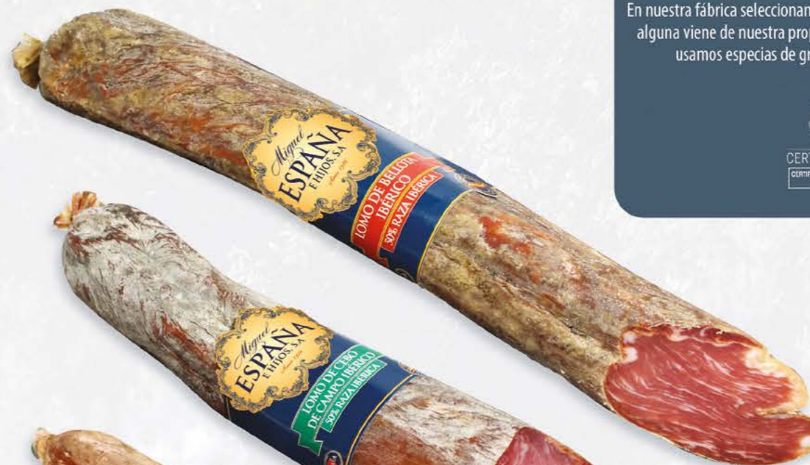
01204 - Lomo de Bellota Ibérico 50% Raza Ibérica 1,1 kg aprox. 8428204000985 6 x caja