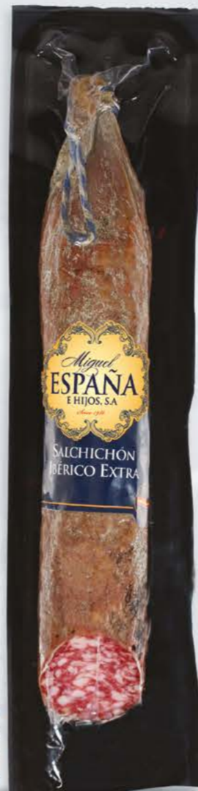
01110V - Salchichón Cular Ibérico Extra 1,1 kg aprox. 8428204000237 6 x caja