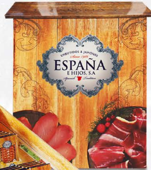
07130 - Mesa de Degustación (An.: 70 cm / Al.: 80 cm / Prof.: 40 cm)