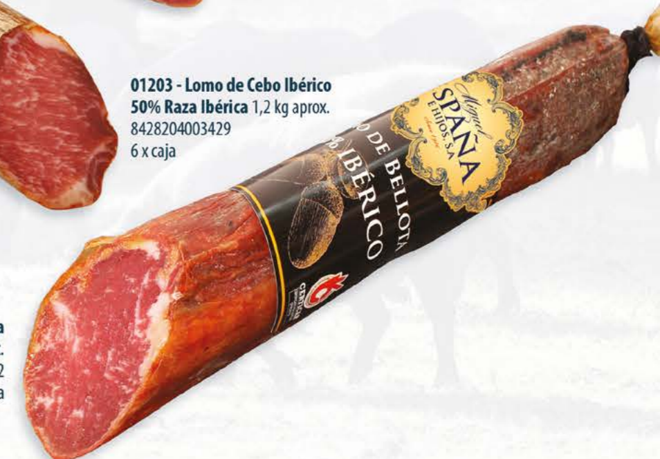
01207 - Lomo de Bellota 100% Ibérico 1,1 kg aprox. 8428204007182 6 x caja