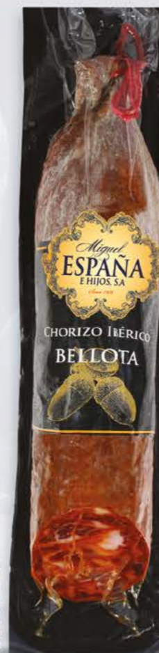
01005P - Chorizo Cular Ibérico Bellota 1,1 kg aprox. 8428204000282 6 x caja