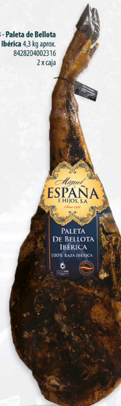
02108 - Paleta de Bellota 100% Ibérica 4,3 kg aprox. 8428204002316 2 x caja