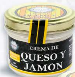
03839ESP - Crema de Queso y Jamón 100 g 8436567892642 48 x caja