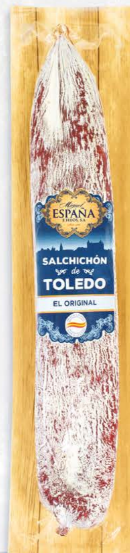
01145 - Salchichón de Toledo 520 g 8428204006192 6 x caja