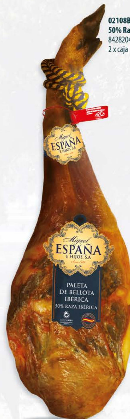
02108B - Paleta de Bellota Ibérica 50% Raza Ibérica 4,3 kg aprox. 8428204011752 2 x caja