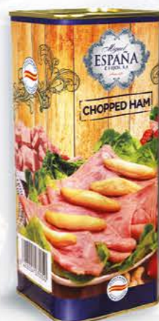
03005 - Chopped ham 2,2 kg aprox. 842204002101 6 x caja