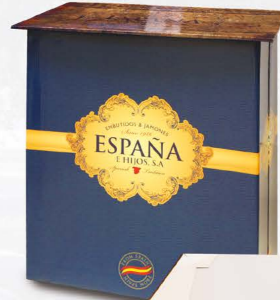
07130IB - Mesa de Degustación (An.: 70 cm / Al.: 80 cm / Prof.: 40 cm)