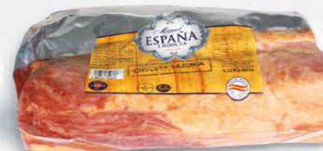
03050 - Chuleta de Sajonia Mitades 3,6 kg aprox. 843700265182 2 x caja