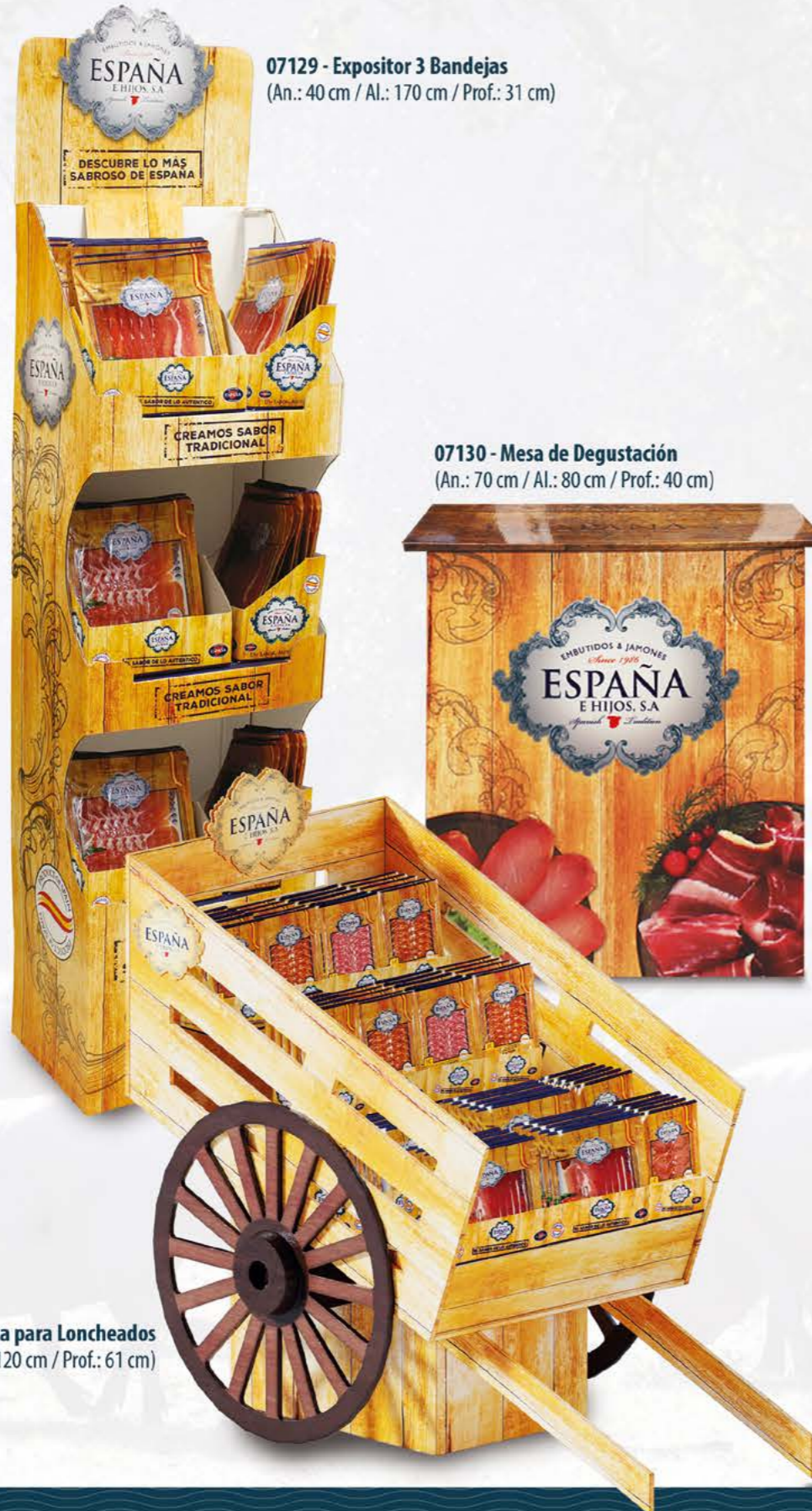
07129 - Expositor 3 Bandejas (An.: 40 cm / Al.: 170 cm / Prof.: 31 cm)