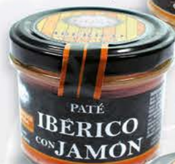
03815ESP - Paté Ibérico con Jamón 100 g 8436567891560 48 x caja