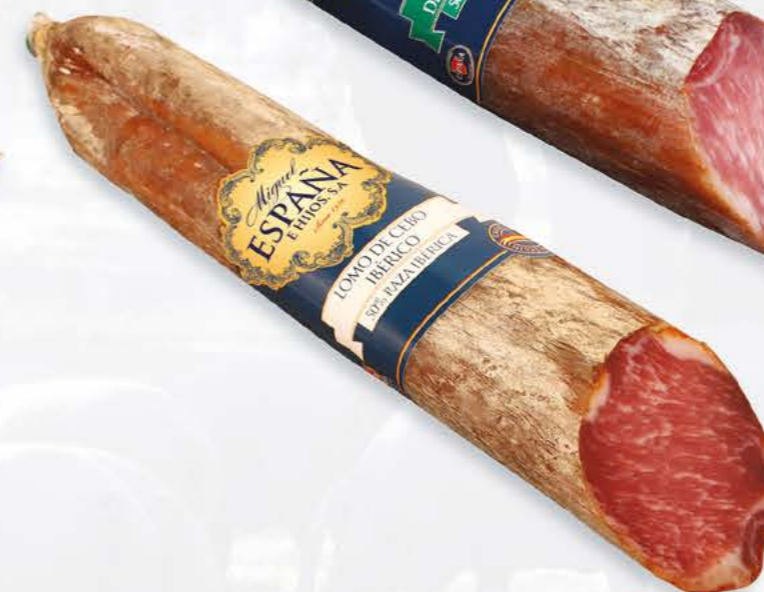
01203 - Lomo de Cebo Ibérico 50% Raza Ibérica 1,2 kg aprox. 8428204003429 6 x caja