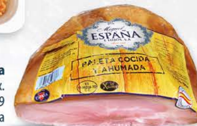
03051 - Paleta Ahumada Mitades 2,8 kg aprox. 8437002658229 2 x caja