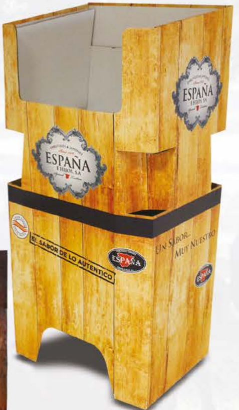
07187 - Expositor Sobres sin Frío (An.: 104 cm / Al.: 50 cm / Prof.: 37 cm)