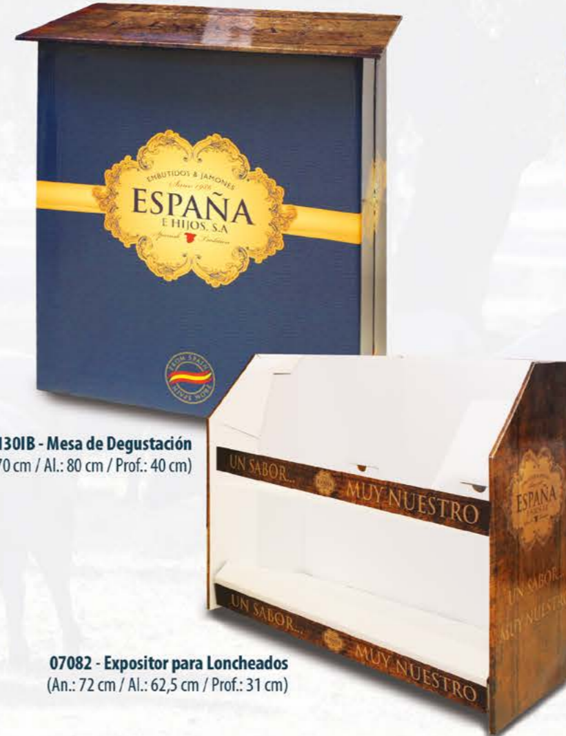
07082 - Expositor para Loncheados (An.: 72 cm / Al.: 62,5 cm / Prof.: 31 cm)