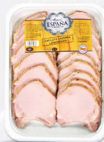
03049 - Chuleta de Sajonia Loncheada 125 g 8436034750529 2 x caja