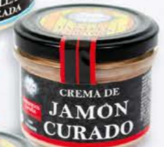
03816ESP - Crema de Jamón Curado 100 g 8436567891577 48 x caja