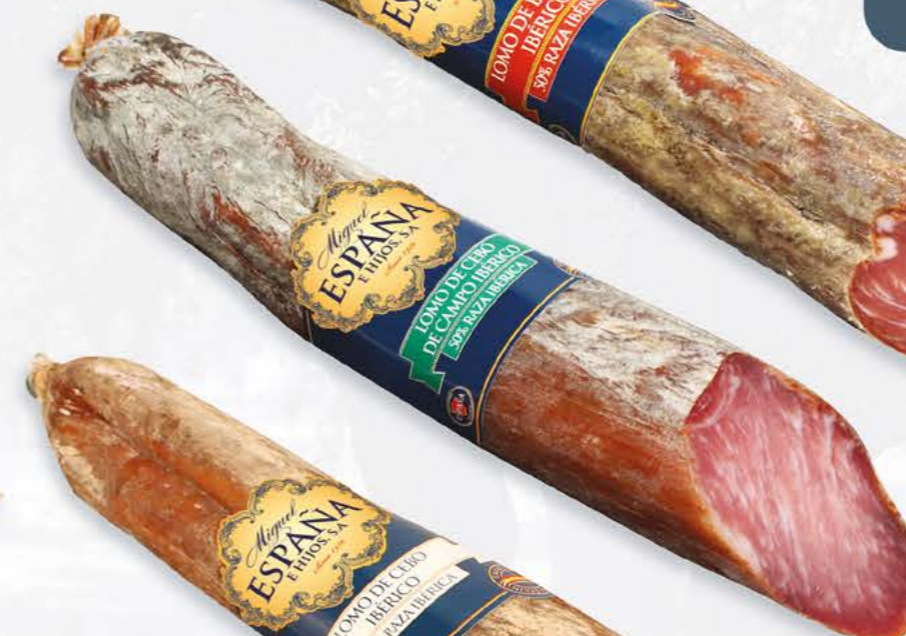
01260 - Lomo de Cebo de Campo Ibérico 50% Raza Ibérica 1,1 kg aprox. 8428204009827 4 x caja