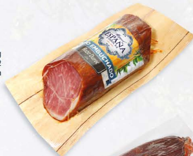
01205 - Lomo Gran Reserva Mitades 1,4 kg aprox. 8428204001166 6 x caja