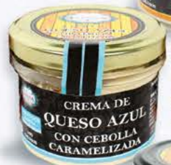
03834ESP - Crema de Queso con Cebolla Caramelizada 100 g 8436567892659 48 x caja