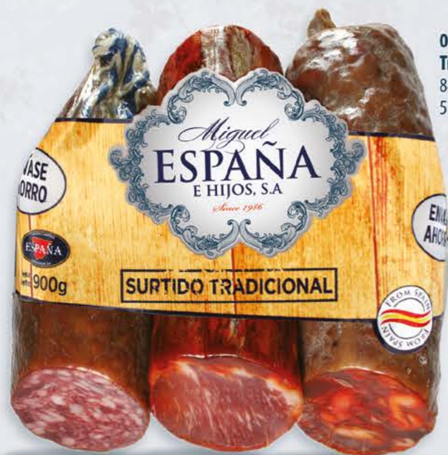
01524 - Surtido Tradicional 900 g 8428204015248 5 x caja