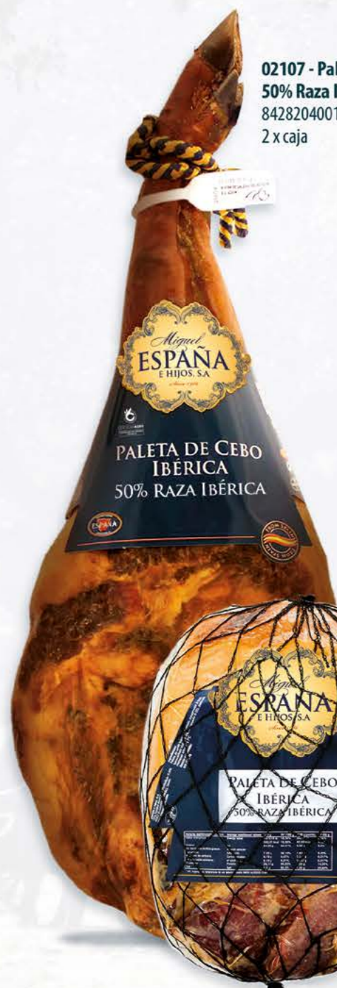
02107 - Paleta de Cebo Ibérica 50% Raza Ibérica 4,3 kg aprox. 8428204001760 2 x caja