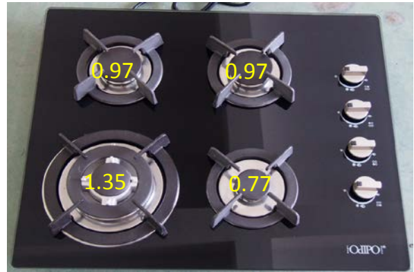
PARRILLA CLIO código 60032