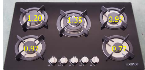
PARRILLA CAPELLA código 60033