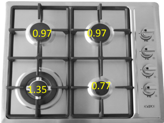
PARRILLA VULCANO código 60035