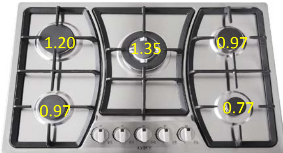
PARRILLA VIGNUS código 60036