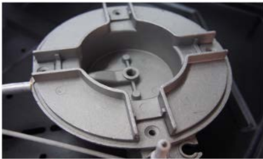
Paso 5.- se muestra base del quemador libre de la boquilla actual de gas LP