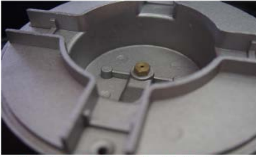
Paso 1.- retire la araña de hierro fundido y el quemador para dejar al descubierto la boquilla actual de gas LP