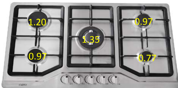
PARRILLA VESTA código 60037