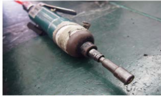
Paso 2.- utilice una herramienta neumatica (carraca) con un dado de 1/4" ver foto