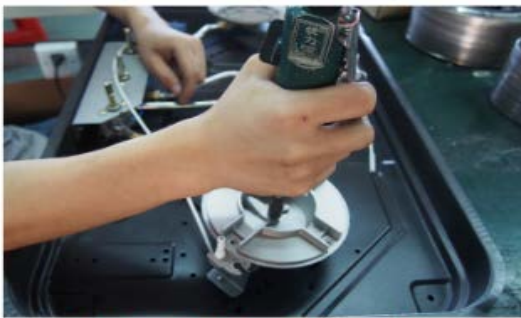
Paso 3.- desatornille la boquilla actual del quemador