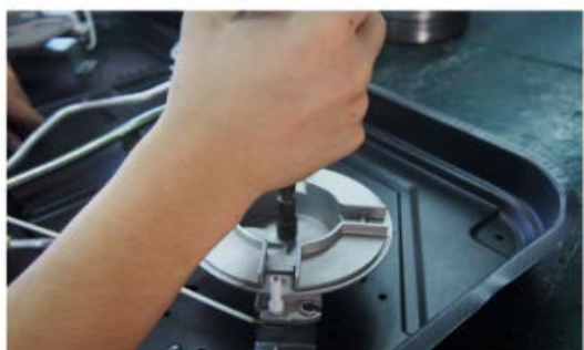
Paso 6.- atornille la correspondiente nueva boquilla para gas natural utilizando la herramienta neumatica