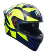
SOLELUNA 2018 279,95 EUR IVA Inc