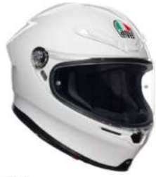
WHITE 449,95 EUR IVA Inc 218395001 010