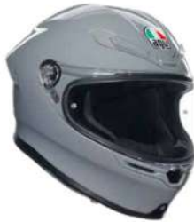
NARDO GREY 479,95 EUR IVA Inc 218395001 052