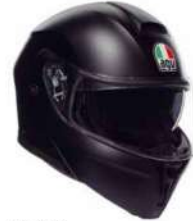
MATT BLACK 309,95 EUR IVA Inc 2118296001 001