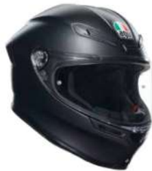
MATT BLACK 479,95 EUR IVA Inc 218395001 011