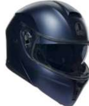
MONO MATT PROFONDO BLUE 309,95 EUR IVA Inc 2118296001 008