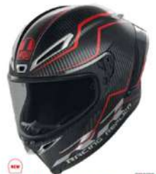
PERFORMANCE CARBON/RED 1540 EUR IVA Inc 218356002 017