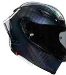
MONO IRIDIUM CARBON 1480 EUR IVA Inc 218356002 012