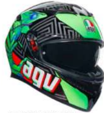
KAMALEON BLACK/RED/GREEN 269,95 EUR IVA Inc