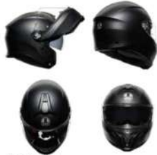
NEGRO MATE 201251E40Y 003