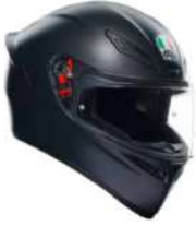
MATT BLACK 209,95 EUR IVA Inc