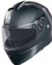
RESIA MATT GREY/SILVER/RED 349,95 EUR IVA Inc 2118296001 006