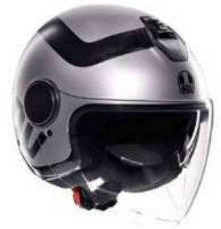
RIMINI MATT GREY/BLACK 159,95 EUR IVA Inc