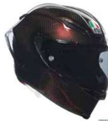
MONO RED CARBON 1480 EUR IVA Inc 218356002 011