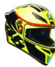
GRAZIE VALE 279,95 EUR IVA Inc