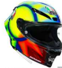
SOLELUNA 2021 1815 EUR IVA Inc 218356002 010