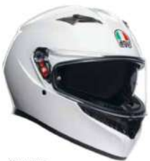
SETA WHITE 219,95 EUR IVA Inc