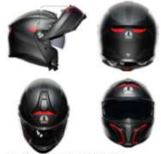
FREQUENCY MATT GUNMETAL 201251E40Y 005