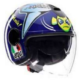
ROSSI MISANO 2015 199,95 EUR IVA Inc