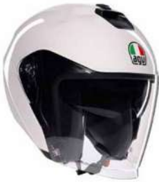
MONO MATERIA WHITE 159,95 EUR IVA Inc 2108449001003