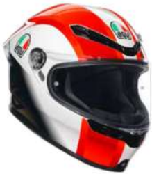
SIC58 559,95 EUR IVA Inc 21839501 004