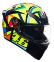
SOLELUNA 2017 279,95 EUR IVA Inc