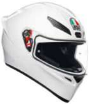
WHITE 199,95 EUR IVA Inc