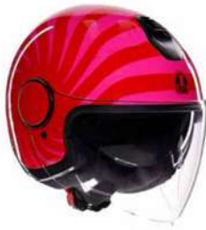
TROPEA RED/PINK 159,95 EUR IVA Inc