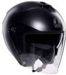
MONO MATT ARDESIA GREY 169,95 EUR IVA Inc 2108449001005