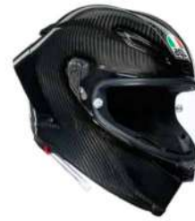
MONO GLOSSY CARBON 1430 EUR IVA Inc 218356002 008