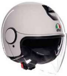
MONO MATERIA WHITE 129,95 EUR IVA Inc