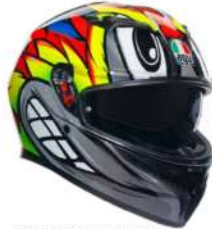
BIRDY 2.0 GREY/YELLOW/RED 269,95 EUR IVA Inc