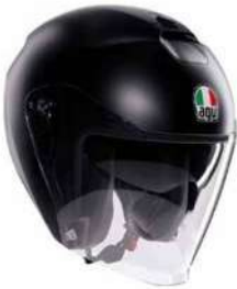
MONO MATT BLACK 169,95 EUR IVA Inc 2108449001002