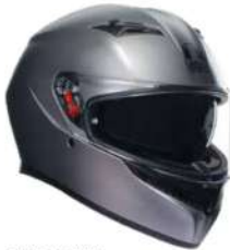
RODIO GREY MATT 229,95 EUR IVA Inc