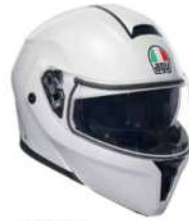
MATERIA WHITE 299,95 EUR IVA Inc 2118296001 003

FITTING A MEDIDA - Carrileras extraíbles - Se pueden intercambiar totalmente entre todas las tallas