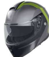
RESIA MATT GREY/BLACK/YEL FLUO 349,95 EUR IVA Inc 2118296001 007