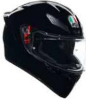
BLACK 199,95 EUR IVA Inc