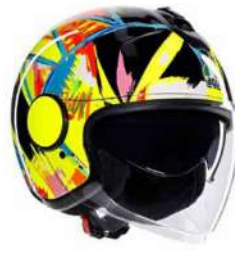
ROSSI WINTER TEST 2019 199,95 EUR IVA Inc