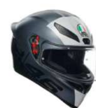
LIMIT 44 279,95 EUR IVA Inc