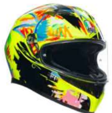
ROSSI WINTER TEST 2019 299,95 EUR IVA Inc