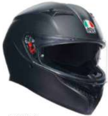
MATT BLACK 229,95 EUR IVA Inc