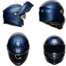
GALASSIA BLIE MATT 201251E40Y 004