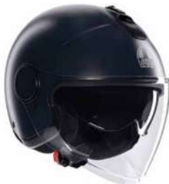
MONO MATT BLACK 139,95 EUR IVA Inc