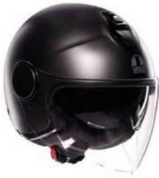
MONO ASFALTO GREY 139,95 EUR IVA Inc