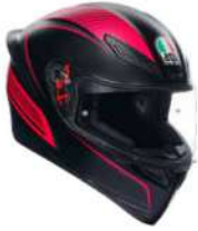
WARMUP BLACK/PINK 239,95 EUR IVA Inc