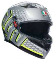
FORTIFY GREY/BLACK/YELLOW FLUO 269,95 EUR IVA Inc