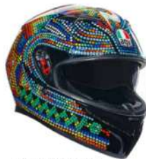
ROSSI WINTER TEST 2018 299,95 EUR IVA Inc