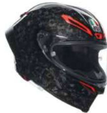
ITALIA CARBONIO FORGIATO 1815 EUR IVA Inc 218356002 013