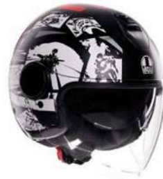
HISTORY MATT BLACK/WHITE/RED 159,95 EUR IVA Inc