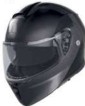
RESIA MATT BLACK/GREY 349,95 EUR IVA Inc 2118296001 005