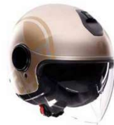
SIRLO WHITE/GOLD 159,95 EUR IVA Inc