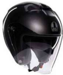
MONO MATT PREGIATO BRONZE 169,95 EUR IVA Inc 2108449001007