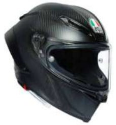
MONO MATT CARBON 1430 EUR IVA Inc 218356002 007