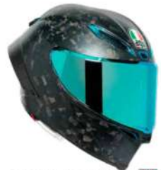
FUTURO CARBONIO FORGIATO 1815 EUR IVA Inc 218356002 004