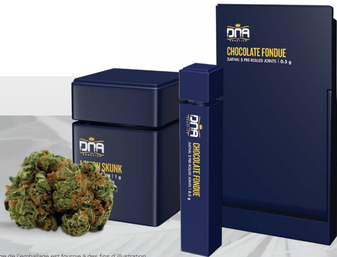
L'image de l'emballage est fournie à des fins d'illustration seulement et diffère de l'emballage du produit vendu au détail.